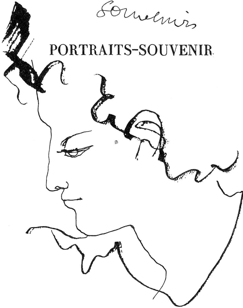
Planche 3. Envoi de Jean Cocteau