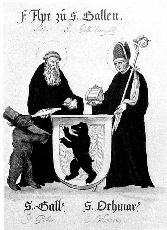
Abb. 7. Vier stärker verkleinerte Aquarelle in della Torre