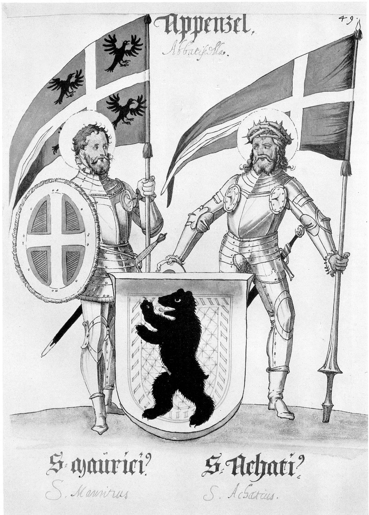
Abb. 3. Wappen von Appenzell in della Torre