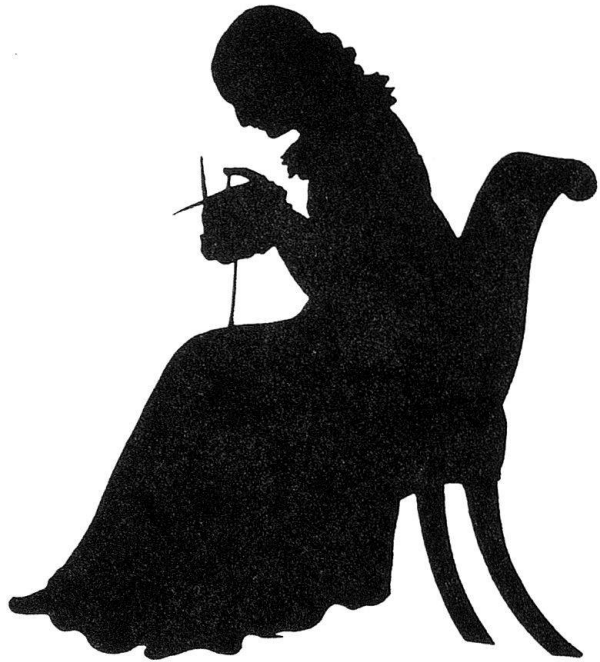
Abb. 8. Eines der zahlreichen Porträts strickender Damen

Beweist schon der Ernst und die Achtung, womit hier der Künstlerin gedacht wird, daß ihre Arbeiten nicht nur einem kleinen Kreise von Freunden bekannt waren, so verdienen zwei frühere Erwähnungen ihres Namens im Morgenblatt gerade im Zusammenhang mit der Frage der Verbreitung und Wertschätzung der sogenannten Kleinkunst Beachtung. In dem ohne Angabe des Verfassers erschienenen Bericht «Die erste Kunstausstellung in Stuttgart» (Morgenblatt für gebildete Stände vom 5. Juni 1812, S. 537) findet sich folgende Notiz: