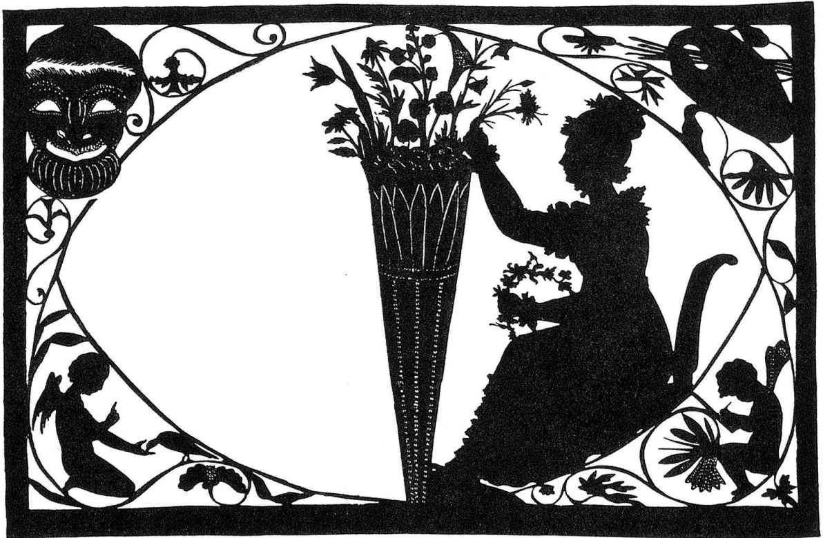
Abb. 9. Selbstbildnis(?) der Künstlerin, einen Kranz flechtend (verkleinert)

fehlenden Namensnennung mit Ausnahme der Bearbeiter der Schriften zur Kunst in der Sophien-Ausgabe (s. Register) in neuerer Zeit, wie es scheint, niemand bemerkt hat. Im 4. Bande von «Kunst und Alterthum» (2. Stück, S. 49) war seine Übersetzung eines neugriechischen Gedichts, «Charon» betitelt, mitgeteilt worden, «auch S. 165 gezeigt, daß es sich wohl für Darstellung der bildenden Kunst eignen möchte, worauf sodann im Stuttgarter Kunstblatt von 1824 Nr. 6 vom 19. Januar jenes Gedicht sowohl als die Nachschrift abgedruckt zu lesen war, mit beigefügter Erklärung des Herrn von Cotta, der sich geneigt erwies, ihm zugesendete Zeichnungen dieses Gegenstandes nach Weimar zu befördern, auch die, welche für die beste erkannt würde, dem Künstler zu honoriren und durch Kupferstich vervielfältigen zu lassen». Es wurden nun von Stuttgart sechs Zeichnungen verschiedener Künstler eingesandt, von deren Verdiensten Goethe gemeinsam mit dem «Kunstfreund» Heinrich Meyer «in aufsteigender Reihe» Bericht gab 3 . Den Preis erhielt nach dieser Beurteilung eine Zeichnung von C. Ley-