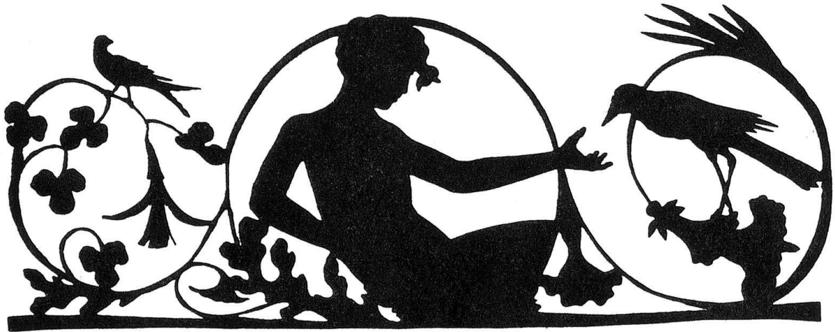
Abb. 1. Arabeske