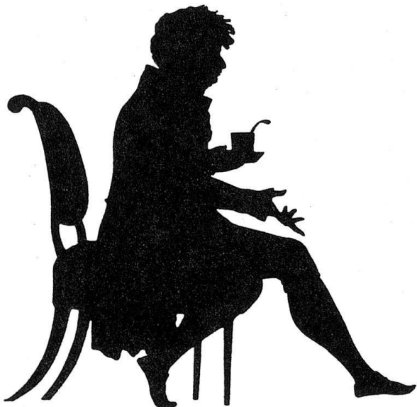
Abb. 7. Colloquium (gering verkleinert)

Wir aber rufen ihr aus der Seele und dem Munde desselben Dichters unsern Dank und unsere Bewunderung nach, indem wir erkennen, daß sie durch ihre Leistungen gezeigt hat, ‚wie auch das scheinbar Kleine und Unbedeutende durch die Ausführung groß und bedeutend werden könne‘.