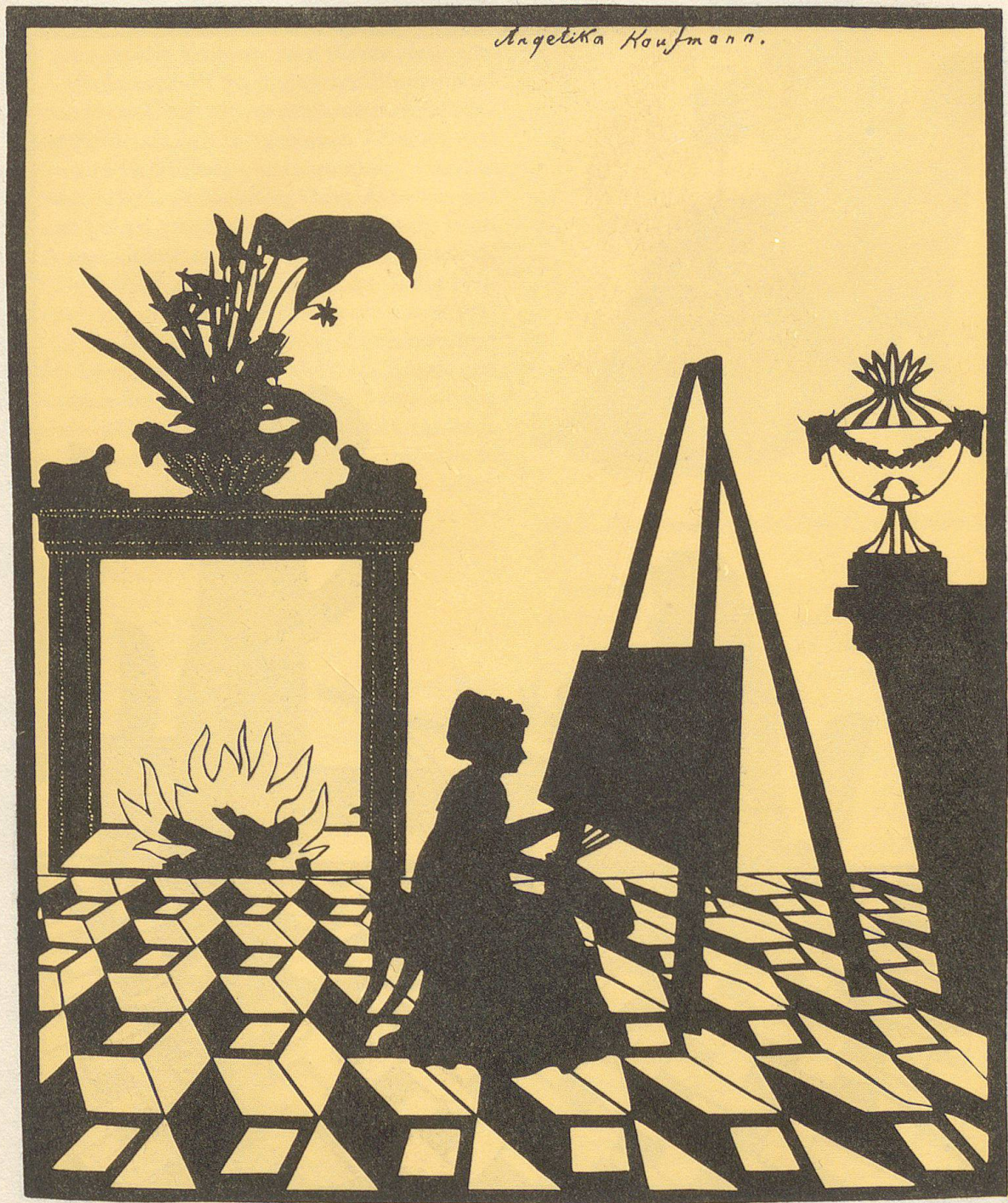
Abb. 5. Angelika Kauffmann in ihrem Atelier in Rom (verkleinert)