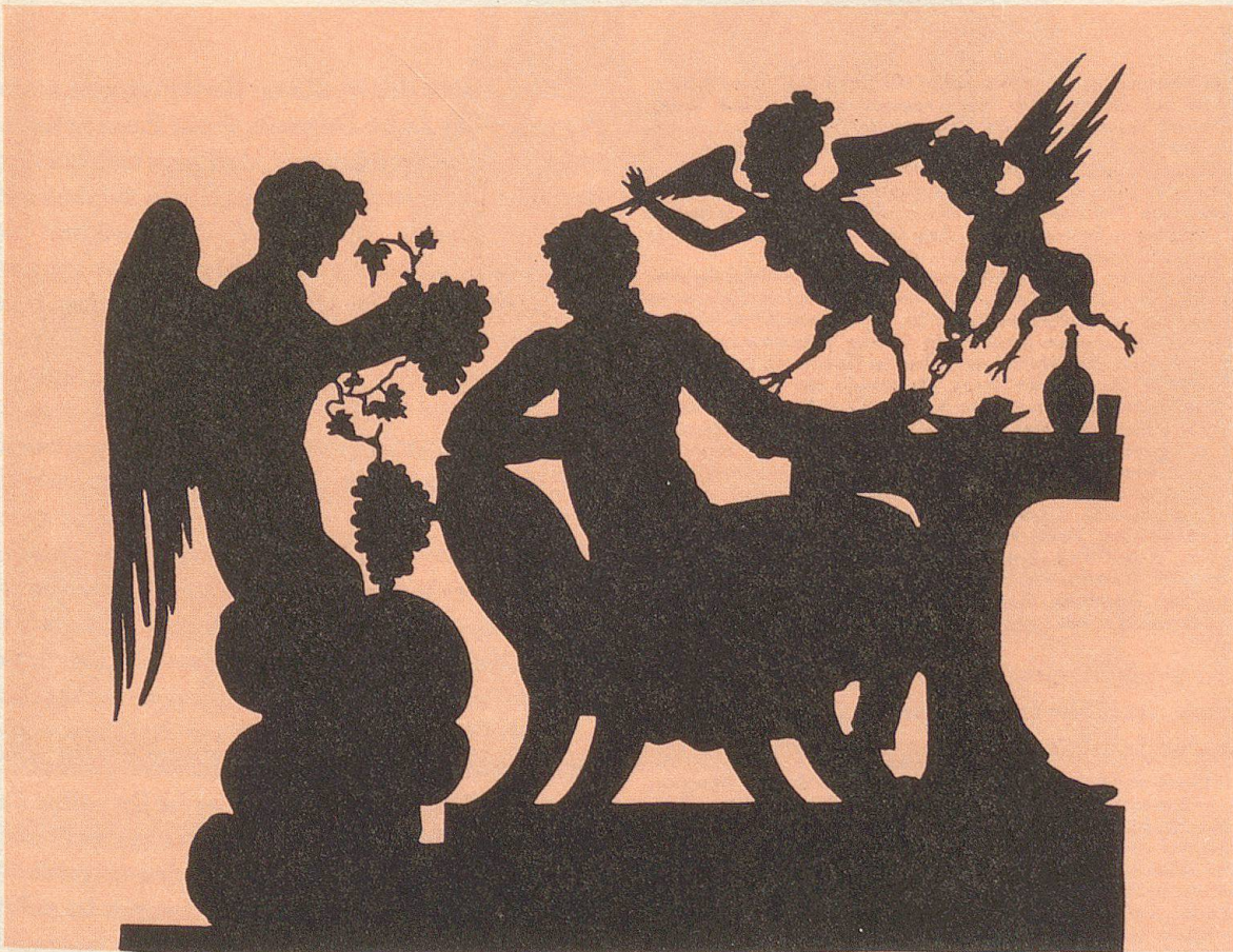
Abb. 12. Harpyien (gering verkleinert)