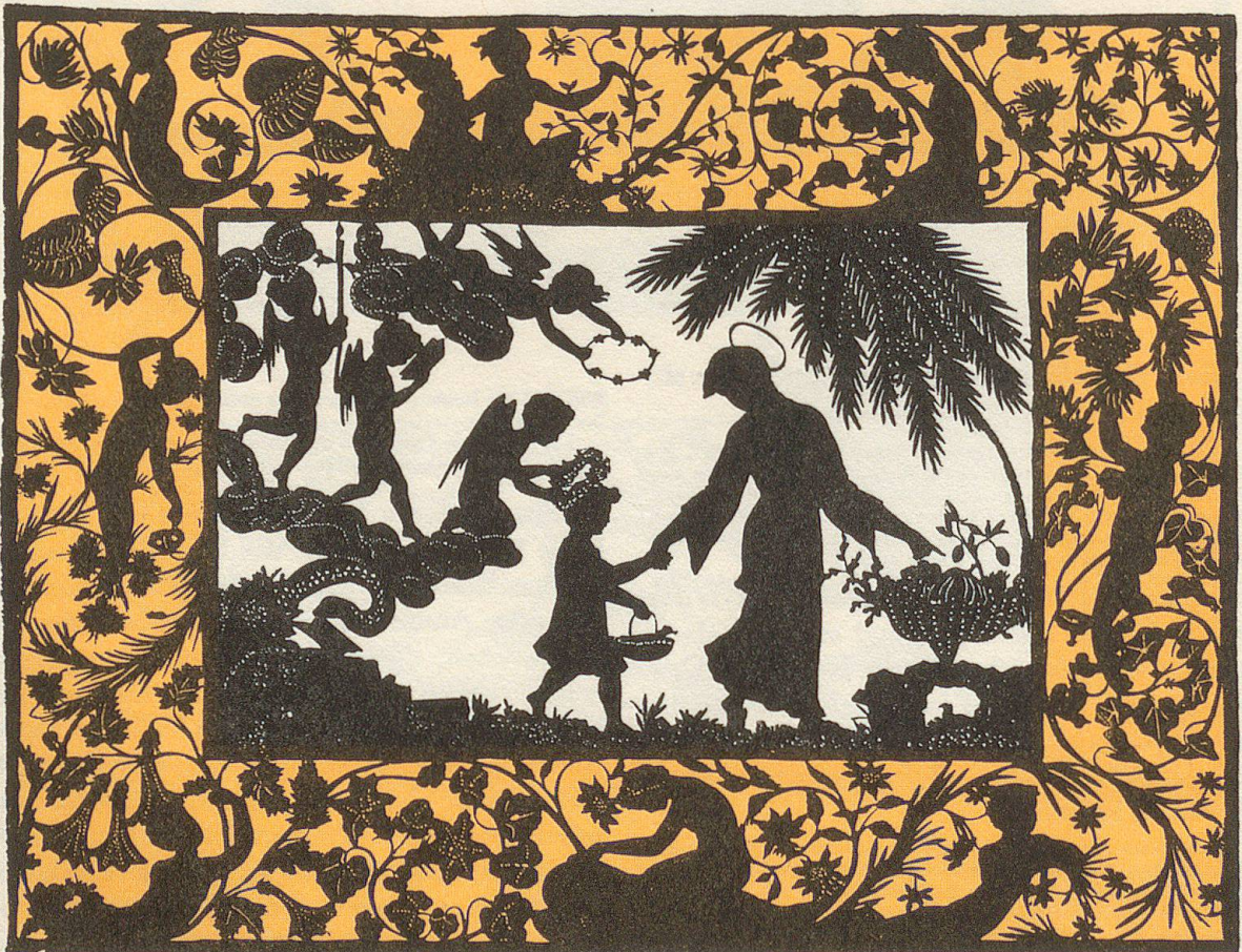
Abb. 20. Legende, mit besonders reichem Beiwerk in der Randleiste. Während bei den Darstellungen mit wechselnden Mosaikböden Raumwirkung angestrebt wird und die Figuren aufgesetzt sind, ist bei den späten, mehr flächigen Arbeiten wie dieser Erzählung das Ganze aus einem Stück geschnitten (verkleinert)

5 Die beiden Briefe sind veröffentlicht von F. Seeß in «Eduard Mörike. Briefe» (S. 89) und «Eduard Mörike. Unveröffentlichte Briefe» (1945, S. 259f.). Im Herbst 1838 hat Mörike in Stuttgart «ein freundliches Zimmer in der Gerberstraße Nr. 10 bei Herrn Duttenhofer» bezogen (vgl. Brief vom 8. November 38 an Mutter und Schwester; Seeß, Briefe S. 466).