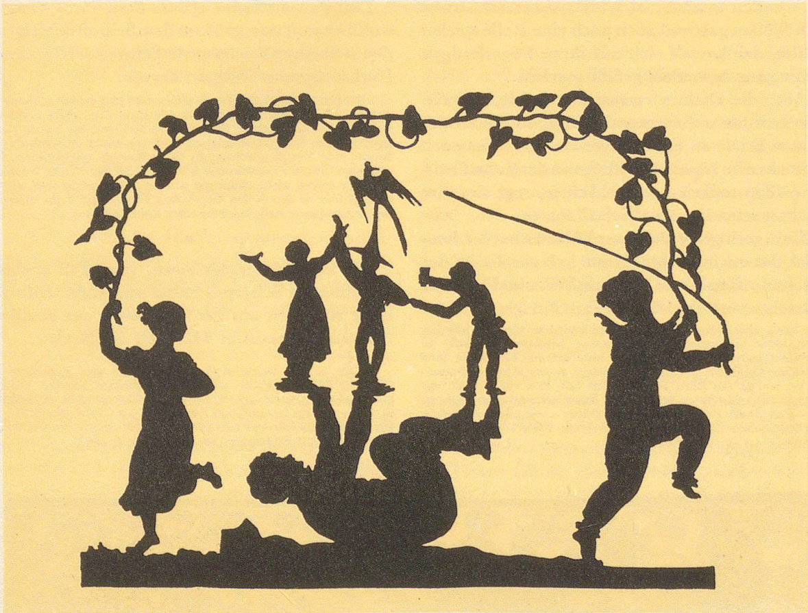
Abb. 19. Spielerei (gering verkleinert)

es seiner Kunstfreundin angetan hatten, ihr ein handschriftliches Gedicht geschenkt hat: