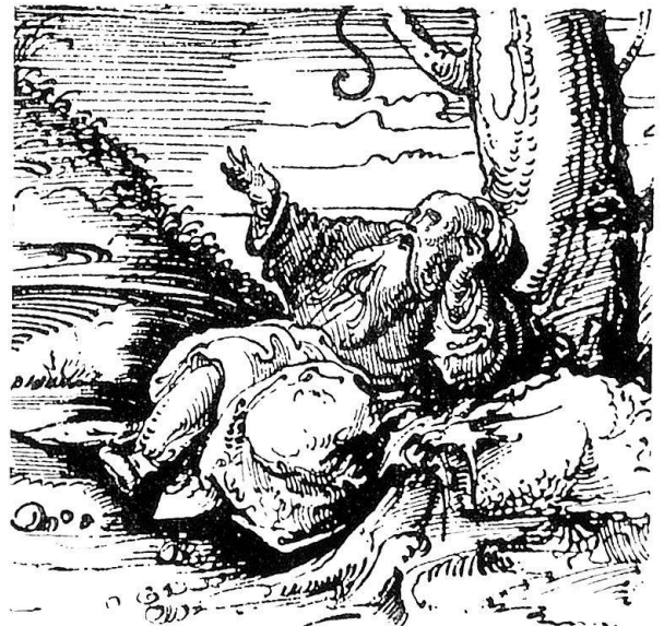
Abb. 16. Detail aus einer Burgkmair bzw. dem Petrarcomeister zugeschriebenen Randzeichnung des Maximilian-Gebetbuches von 1515

zunächst den Anschein hat, denn die Johannesaltarskizze ist der Angelpunkt einer ganzen Gruppe von Burgkmair zugewiesenen Zeichnungen. Wie weit sich diese Zuweisungen bei Herausnahme der Johanneskizze noch halten lassen, ob etwa die sämtlichen um sie gruppierten Blätter als Arbeiten des Petrarcomeisters anzusehen und damit, analog den Erkenntnissen auf dem Gebiet des Holzschnittes, auch Zeichnungen des Petrarcomeisters aus dem (Fuvre Burgkmairs herauszusondern sind, vermag ich nicht zu beurteilen. Sollte sich jedoch ein solches Resultat aus den vorliegenden Erwägungen ergeben, was zum Beispiel in Ansehung der Gebetbuchillustrationen des Petrarcomeisters für die beiden Zeichnungen zu einem Marienleben (abgebildet bei Schilling, Wallraff-Richartz-Jahrbuch 1933-34) nicht unwahrscheinlich anmutet, dann würde diese Erkenntnis möglicherweise eine weitere nach sich ziehen, nämlich die, daß für solche Blätter, die Entwürfe zu Altartafeln abgeben, auch die entsprechenden Gemälde, – also beispielsweise sowohl die im Louvre befindlichen Figurenzeichnungen der Innenflügel des Kreuzaltares, wie die Tafeln selbst – von dem Burgkmair-Gesellen, um den es hier geht, herrühren. Wie Burgkmairsche Holzschnitte in Rahmen des Petrarcomeisters gefaßt wurden (M. 584 und B. VII, 4-6), so mag das vom Meister selbst geschaffene Mittelbild des Kreuzaltares von Flügelbildern seines Gesellen, eben des Petrarcomeisters,