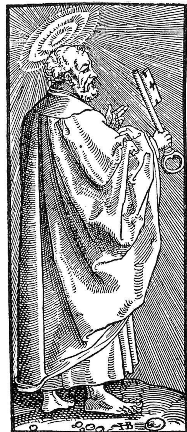
Abb. 4. Hans Brosamer, Holzschnitt aus dem Rahmen des Traubüchleins für die Einfeltigen Pfarrherrn Fft.-M. 1550

mit Steinchen zu verwechselnden «Brosamen», wies ich schon an einem seiner Wappenholzschnitte nach (Gutenberg-Jahrbuch 1953 Abb. 3) und zeige es hier erneut an einem Holzschnitt aus dem Rahmen des Traubüchleins für die Einfeltigen Pfarrherrn, Frankfurt a. M. 1550, doch vielleicht früher entstanden (Abb. 4). Wie ich bereits darlegte, benutzte Brosamer weiterhin Brosamkraut und -blume als redende Signaturen. In einer demnächst zur Veröffentlichung gelangenden Untersuchung über die Burgkmair-Werkstatt und den Petrarcameister weise ich seine Beteiligung an den Weißkunigillustrationen nach, die er als Geselle Burgkmairs unter dessen Monogramm schuf. Eines der dort erwähnten Blätter (Seite 233 der Wiener Faksimile-Ausgabe) zeigt genau in der Mitte des Unterrandes eine Krautpflanze, die vielleicht als Brosamkraut gedeutet werden kann (Abb. 5) und damit den Namen des Künstlers andeutet, ein weiteres Blatt (S. 271 der gleichen Ausgabe) weist neben einem Steinchen mit dem Burgkmairmonogramm die gleiche Pflanze auf. Dieselbe Pflanze findet sich auch in