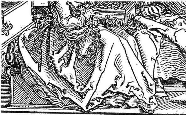
Abb. 3. Petrarcameister, Detail des Holzschnitts M. 139

schnitte Hans Brosamers, nämlich nicht nur unsignierte, sondern auch solche, die H.B. monogrammiert sind, heute noch als Beham angesprochen werden, mag es zur richtigen Bestimmung derselben von Nutzen sein, die redenden Signaturen jenes Brosamer mit heranzuziehen.