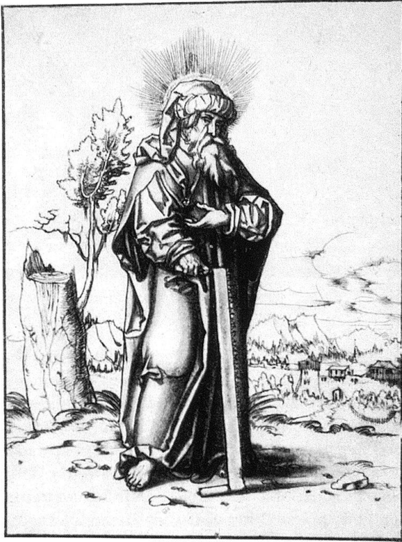
Abb. 6. Apostel Simon