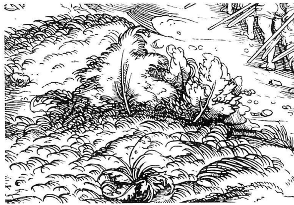
Abb. 5. Detail eines Weißkunigholzchnitts (Wiener Faksimile-Ausgabe S. 233)

Als Vergleich zu Simon mit der Kappe (Abb. 10) sei ein Ausschnitt aus dem Ciceroholzchnitt des Petrarcameisters «Einer siebt Menschen- und Tierköpfe» (M. 489) gezeigt (Abb. 11). Laubbehandlung und Faltung des Kopftuches stehen sich außerordentlich nahe. Weitere Ähnlichkeiten ergeben sich beim Vergleich von Nase und Bart mit dem Trostspiegelholzchnitt «Einem mit Szepter wird ein Buch präsentiert» (M. 105); die geteilten langen, in einzelnen Strähnen herabwallenden Bärte und der nach unten hängende Schnurrbart sind vielfach beim Petrarcameister zu finden, so etwa an einer Gestalt im Hintergrund des Trostspiegelholzchnitts zum Kapitel «Von Freundschaft» (M. 112) oder beim verspotteten Greis (M. 156); die Laubbehandlung mag man mit dem Laub der Trostspiegelillustration «Entführung einer Frau in einen Wald» (M. 207) vergleichen, wie denn die Laubwiedergabe beim Apostel Bartholomäus mit einem Detail aus dem in meinen eingangs erwähnten Ausführungen gezeigten Ciceroholzchnitt «Der Wanderer auf hohem Steg» (M. 495) zusammengeht. Die Wolkenbildung der Zeichnungen etwa im Hintergrund der Bartholo-