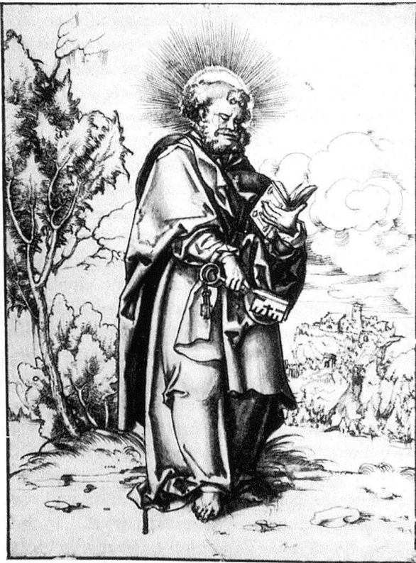
Abb. 8. Apostel Petrus