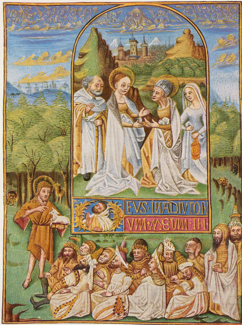
Heimsuchung der Maria. Randleiste: Predigt des Johannes