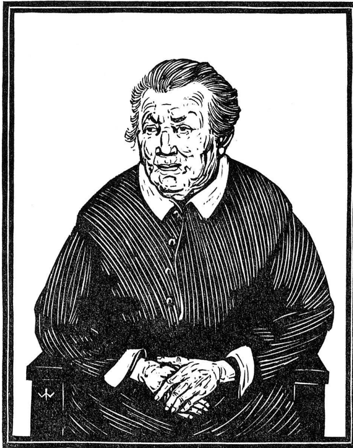
Abb. 1. Josef Weisz. Bildnis der Mutter des Künstlers.

Versunkenheit rufen zu können, in vergleichender Betrachtung, daß alle Wege des Formens zu dem einen Ziel führen: aus dem Holz das in ihm Lebendige zu locken. Erde, Wasser und Luft, flatternde Vögel und alles Getier, das Angesicht des Menschen, seine Liebe und seine Not, schlummert im Saft des Holzes und drängt nach Bildern.