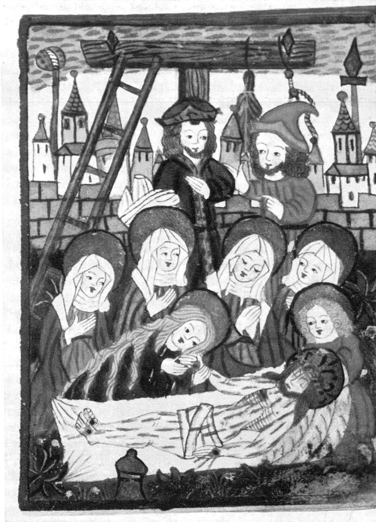
12. Beweinung Christi, im Hintergrund die Leidenswerkzeuge. Miniatur auf Pergament aus dem Nonnenbrevier des Basler Klosters der Reuerinnen der hl. Maria Magdalena (vgl. oben ihr Salbtöpf) an den Steinen, Bl. 62r. Basler Volkskunst Ende 15. Jahrhundert: die großen weißen Tränen und zinnoberroten Blutstriemen. – Fast originalgroß (Original: 8,6 × 11,5 cm). Universitäts-Bibliothek Basel. – Seite 168-69, 170-71 (Anm. 5), 172 (Anm. 30, 38-40).

ler Klöster. Wird es nun in unserm ganzen Zusammenhang, etwa gerade in Hinsicht auf unser Nonnenbrevier aus der Steinen, nicht doch wahrscheinlich, daß der nur in drei Stücken erhaltene Altar für das Magdalenenkloster in Basel bestimmt war? Jedenfalls befinden wir uns, was Stil, Ikonographie und das bestimmte Ambiente anbetrifft, in Basler Atmosphäre 42 .