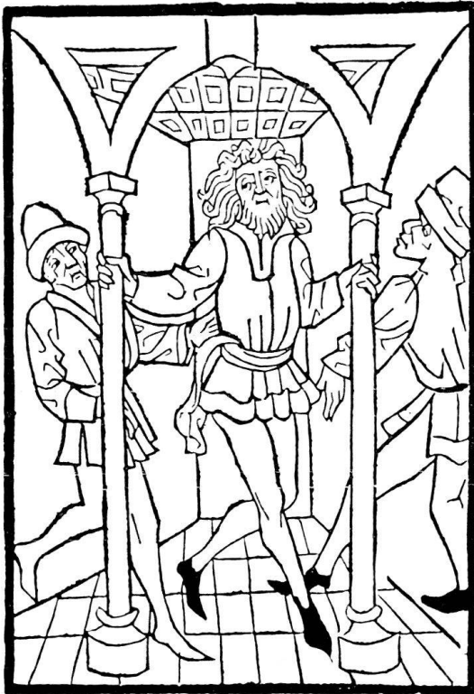
3. Simson reißt die Säulen im Palast zu Gaza ein. Holzschnitt des ersten Meisters aus dem Spiegel menschlicher Behaltnis, Basel: Bernhard Richel, 1476, 31. August, Bl. 98vb. – Verkl. (Original 9,1 × 13,3 cm). Ex. Universitäts-Bibliothek Basel. – Seite 165.