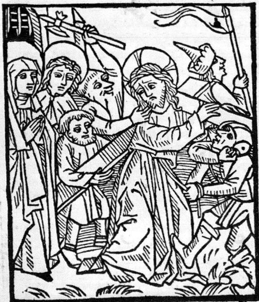
9. Kreuztragung Christi. Holzschnitt, vielleicht von Leonb. Ysenbut selbst, aus der lateinischen Ausgabe der Wallfahrt oder Pilgerschaft Mariae (Itinerarius sive peregrinarius B. V. M.), [Basel:] Leonhard Ysenbut [1489], Bl. 70v. – Leicht verkleinert (Original: 6,4 × 7,6 cm). Ex. der Universitäts-Bibliothek Basel mit Linierung im Charakter der Handschriften, ehemals Geschenk des Druckers an die Basler Kartause. – Seite 159, 161, 163, 169, 171 (Anm. 8).