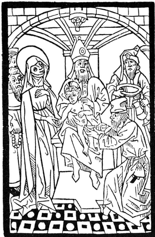
8. Beschneidung Christi. Holzschnitt des ersten Meisters aus dem Spiegel menschlicher Behaltnis, Basel: Bernb. Richel 1476. 31. August, Bl. 24ra. – Verkleinert (Original: 8,75 × 13,1 cm). Ex. Universitäts-Bibliothek Basel. – Seite 167.