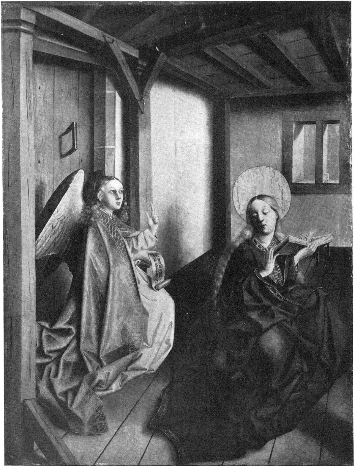
5. Verkündigung Mariae. Außenbild eines Altarflügels; Gemälde von Konrad Witz aus der letzten Zeit des Künstlers († 1445). – Stark verkleinert (Original Leinwand auf Tannenholz nach Katalog des Germanischen Nationalmuseums Nürnberg, Die Gemälde, Beschr. Text , 1937, Nr. 878: 1,201 × 1,565 m). Nürnberg: Germ. Mus. – Seite 167, 169-70, 172 (Anm. 42).