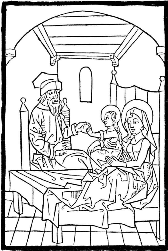
6. Mariae Geburt . Holzschnitt des ersten Meisters aus dem Spiegel menschlicher Bebaltnis , Basel: Bernb. Richel, 1476, 31. August, Bl. 8vb. – Verkleinert (Original: 9 \times 12,1 cm). Ex. Universitäts-Bibliothek Basel. – Seite 168.