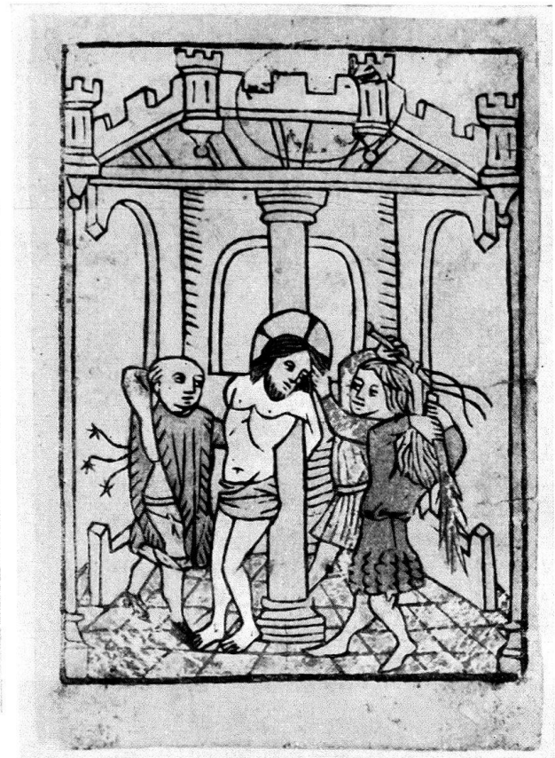
1. Geißelung Christi aus einer Passion. Kolorierter Kupferstich. Kopie des «Meisters der Nürnberger Passion» nach einem verschollenen Original des «Meisters der Spielkarten». Oberrhein. Nicht nach 1441. Leicht vergrößert (Original: 6,1 × 8,6 cm). Ehemals im Stift Nonnberg zu Salzburg. – Nach: Österreichische Kunst-Topographie VII, Figur 274. – Seite 164-165, 167, 168, 172 (Anm. 26, 31, 34).