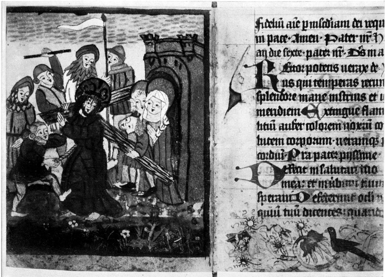
11. Kreuztragung Christi und Zierseite mit Fußleiste. Miniaturen Bl. 51v und 52r (beschnitten) aus derselben Handschrift wie Abb. 10 gegenüber. Zu Vogel und Blüte vgl. Abb. 13! – Etwas verkleinert (Original-Miniatur links: 9 \times 10,8 cm). Universitäts-Bibliothek Basel. – Seite 168-69, 170-71 (Anm. 5), 172 (Anm. 30, 38-40).

Holzschnitten viel schärfer zutage, weil im Stich der Blick durch die an und für sich gute Durchbildung des Gewölbes, d. h. ein plastisches Element, angezogen wird. Der Inkunabelholzschnitt geht auf reine Dekoration aus und versucht durch eine reiche graphische Gestaltung über die Schwächen des unklaren Raumbildes hinwegzutäuschen. Bezeichnend dafür ist die Abb. 8, ebenfalls aus dem genannten Spiegel: die Pracht der Bodenplatten, die Anfüllung mit Figuren und die dekorative Zeichnung des Mauerwerkes, wo der Abhängling der Baldachine noch ein letztes Dasein fristet, drängen den unbewältigten Raum buchstäblich in den Hintergrund.