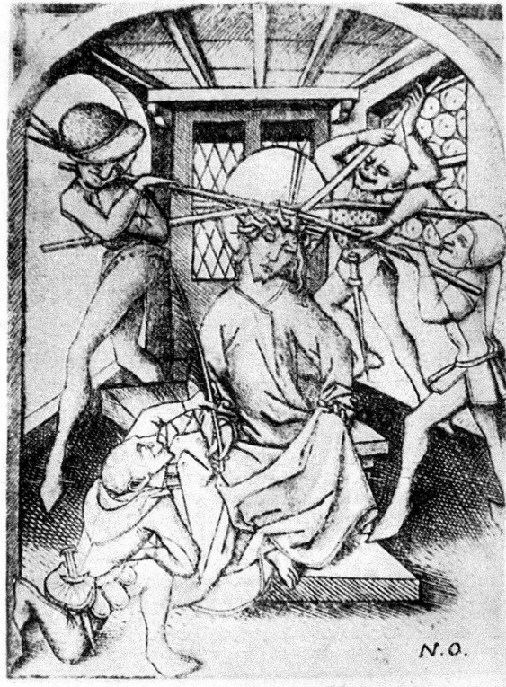
4. Dornenkrönung Christi aus einer Passion. Kupferstich des Monogrammisten E. S., Oberrhein. Nicht nach 1446. – Leicht verkleinert (Original nach Lehrs: 7,4 × 9,9 cm). Bremen: Kunstballe. – Nach: Geisberg, Die Anfänge des deutschen Kupferstiches, 1. A. [1909], Tf. 36, L. 41. – Seite 168, 172 (Anm. 35).

wandt und sie erhält – wiederum außerhalb der Liturgie – wachsende Bedeutung. Sie ist Bußpredigt vor dem Sturm der Reformation! Ihre Form, etwa in den eingestreuten «Glossen» bzw. Predigten im Basler Spiegel menschlicher Behaltnis vom Jahr 1476, nähert sich in der Gliederung und dem Inhalt, in der Betonung von Zahlenverhältnissen der Abschnitte sehr den Andachtsbüchlein. Es wird – wie man das in den Illustrationen unzählige Male findet – «an den Fingern» aufgezählt, was wichtig ist und was sich textlich «folgt». Die Mariana haben ein starkes Gewicht, und so ist es auch in den Devotionalien. Auf den oben zitierten Passus mit dem «geistlichen Spaziergang» folgt sogleich in dem Büchlein der «Wallfahrt und Pil-