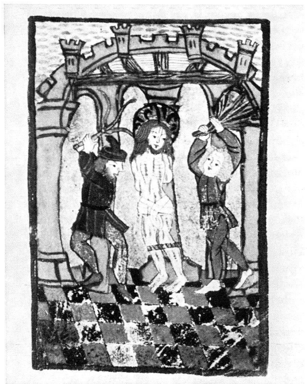
10. Geißelung Christi. Miniatur auf Pergament aus einem Nonnenbrevier des Basler Klosters der Reuerinnen der hl. Maria Magdalena an den Steinen, Bl. 46r. Volkskunst aus dem Ende des 15. Jahrhunderts in Basel. Derselbe Baldachin wie in Abb. 2! – Verkleinert (Original: 7,7 × 11,5 cm). Universitäts-Bibliothek Basel. – Seite 168-69, 170-71 (Anm. 5), 172 (Anm. 30, 38-40).