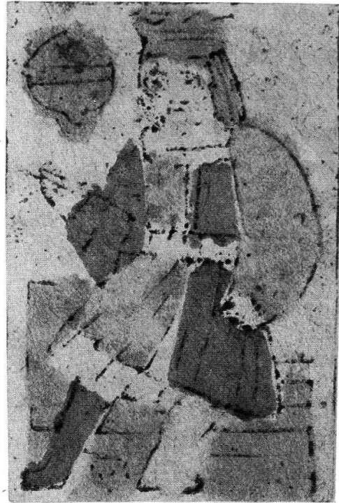
Herzen-Banner und Schellen-König, Holzschnitte, koloriert, deutsch, um 1500