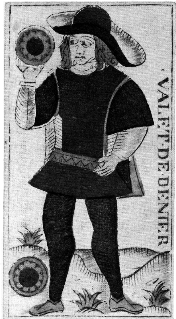
Münzen-Bube, Holzschnitt, koloriert, Tarock, Schweiz, 18. Jahrhundert