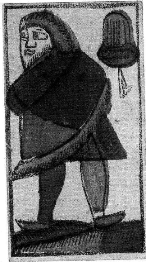
Eichel-Ober, Holzschnitt, koloriert, Basel, Matthias Krebs, 17. Jahrhundert