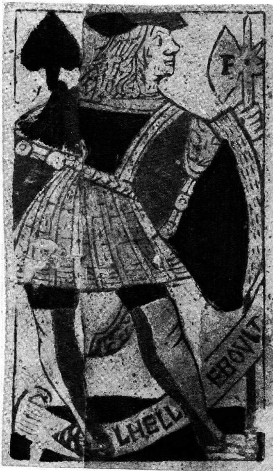
Pique-Bube, Holzschnitt, koloriert, Frankreich, 17. Jahrhundert