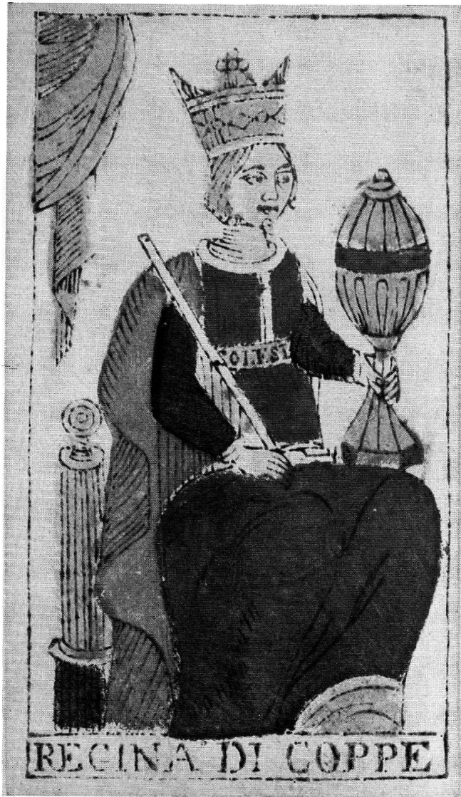
Becher-Königin, Holzschnitt, koloriert, Tarock, Genua, Fratelli Solesi, 18. Jahrhundert