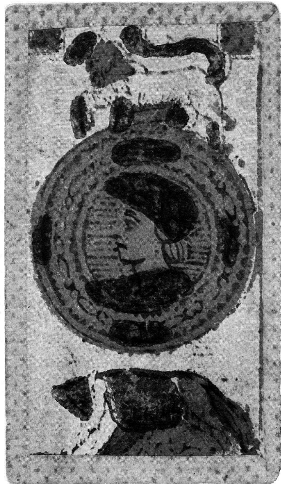
Münzen-As, Holzschnitt, koloriert, Minchiate, Florenz, 17. Jahrhundert