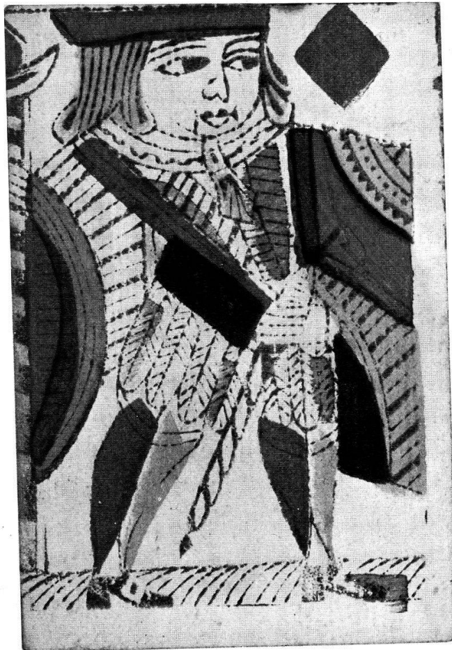
Karo-Bube, Holzschnitt, koloriert, London, 18. Jahrhundert