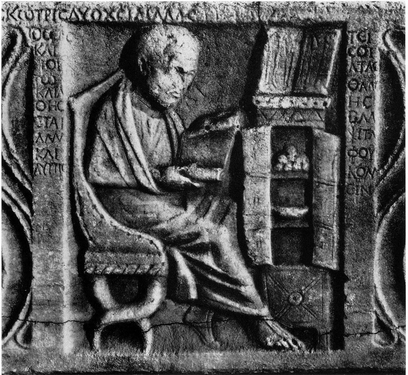
3. Arzt im Jatreion, in seinen Büchern lesend. Römischer Sarkophag, 3. Jahrhundert v. Chr. Ciba-Zeitschrift, S. 1084, April 1936