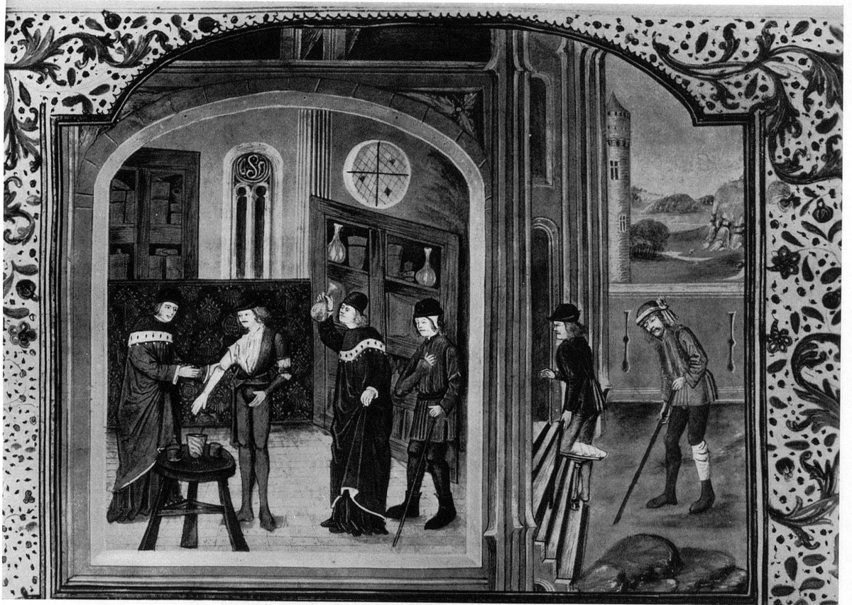
2. Sprechzimmer eines Arztes; er erscheint zweimal bei verschiedenen Verrichtungen. Miniatur, 15. Jahrhundert. Ciba-Zeitschrift, Titelbild April 1936