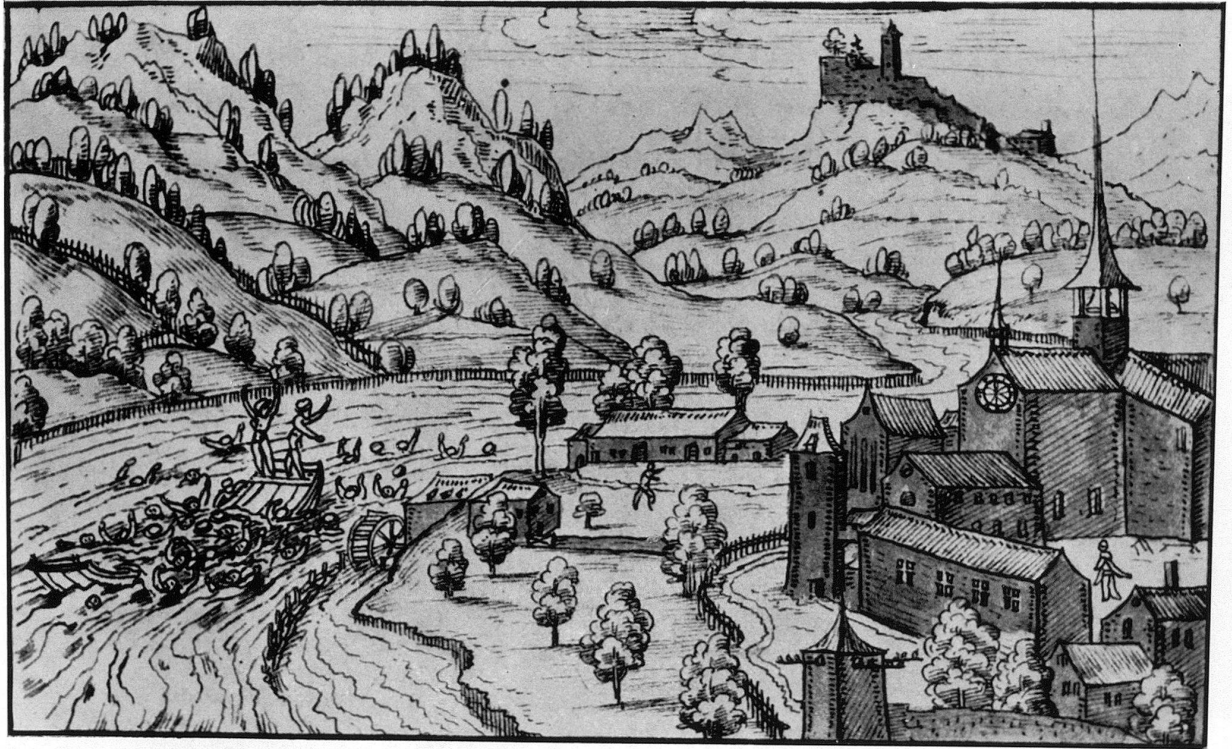
4. Christof Silberisen: Schweizer Chronik. Ansicht des Klosters Wettingen von Nordosten. Die Ansicht zeigt den Zustand (um 1572) vor den großen Umbauten des 17. Jahrhunderts. (Ms. f 16, Bd. 1, fol. 802 r)