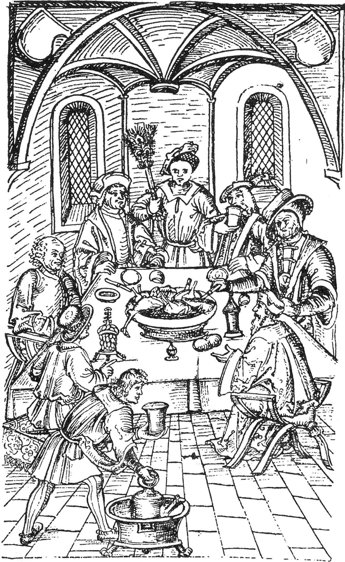
1. Gastmahl des Burgunderherzogs aus Werner Schodoler: Schweizer Chronik (Ms. Zurlauben f 18; fol. 32 v) Die großen Figuren zeigen drastisch den urkräftigen Stil des Illustrators. Um 1530