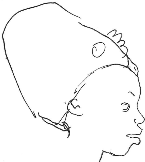
Junge Negerin. Paris, um 1937

tieferen Einlaß in sein Leben – und in unser eigenes – gab. Aus über 5000 Zeichnungen hat Naef in dem bibliophilen Band «Karl Geiser: Zeichnungen» (600 handnummerierte Exemplare, Manesse-Verlag) 117 ausgewählt, in chronologischer Folge herausgegeben, in Lichtdruck sorgfältig reproduziert und durch eine grundlegende Einführung in die großen Ordnungen gerückt. Ergänzend kommt – als Neujahrsblatt der Zürcher Kunstgesellschaft 1960 – der mit peinlicher Genauigkeit gearbeitete Katalog «Der Zeichnungsnachlaß von Karl Geiser» hinzu. Es ist uns vergönnt, aus dem ersten dieser beiden Bücher einige Textabschnitte und aus dem zweiten drei Porträt-Federzeichnungen wiederzugeben.