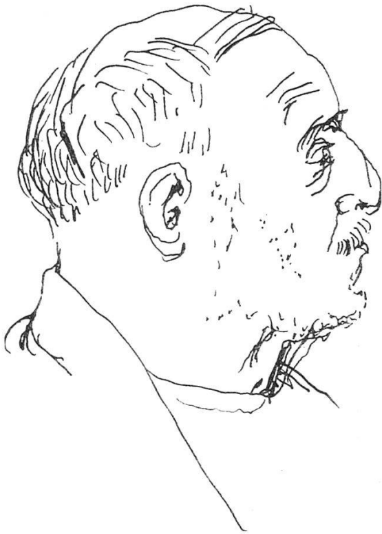
Mann aus dem Volk. 1945er Jahre