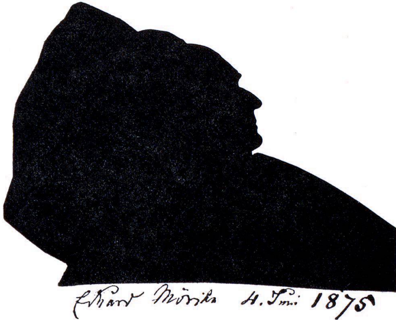
Eduard Mörike zwei Stunden nach seinem Tode, 4. Juni 1875

So reizvoll jede Silhouette als Einzelstück, zumal auch für familiengeschicht-