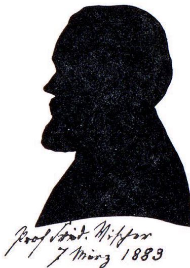
Friedrich Theodor Vischer, der Ästhetiker. 1883

Während Mörikes letzten Lebensjahren bestand eine besonders nahe Verbindung