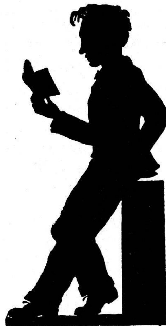
Ernst Penzoldt: Ernst Heimeran. Scherenschnitt