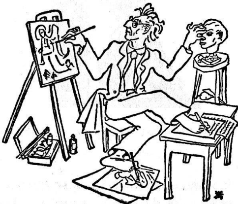
Ernst Penzoldt: Selbstkarikatur als Maler, Dichter und Bildhauer. Federzeichnung

Besucher, die meinen Verlag besichtigen wollen, setzen mich heute noch in Verlegenheit. Ich weiß wohl, was diese Besucher erwarten: Druckereianlagen, Buchbinderei, Papiermaschinen. Das alles gibt es bei mir