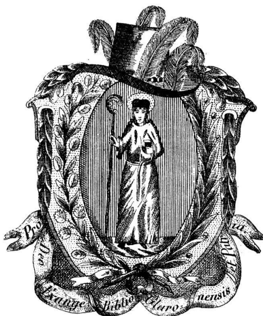
Exlibris der Evangelischen Landesbibliothek Glarus. Lithographie, um 1780