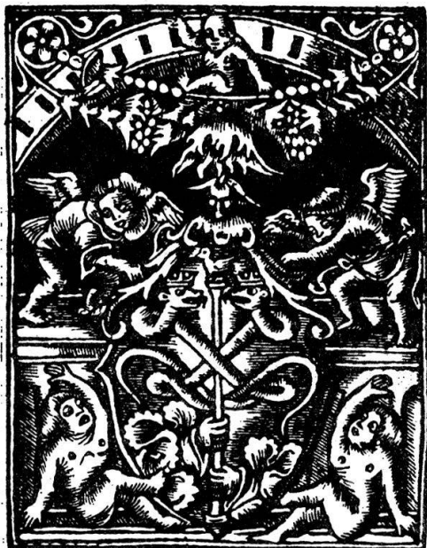
Signet der Druckerei Froben in Glareans « Descriptio Helvetiae », Basel 1519

Initialen geschmückte Seiten. Diese Fassung ist u. a. unter Auslassung der Vadianschen Beilage noch 1735 von Conrad Orelli in