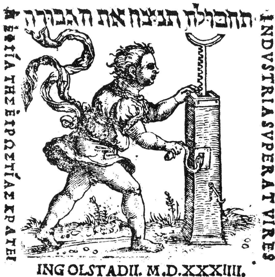
Signet des Druckers Petrus Apianus in seiner Inschriftensammlung