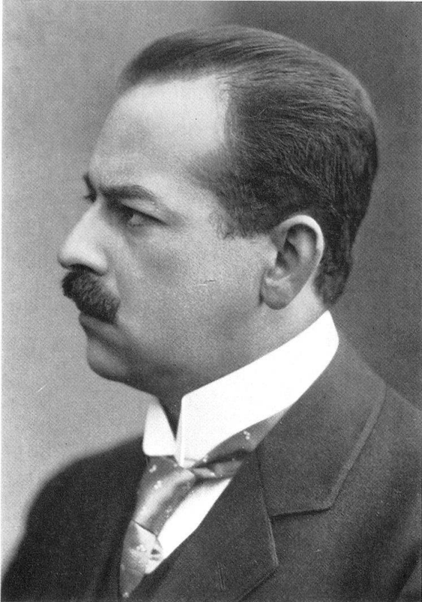
Oswald Spengler im Jahre 1910