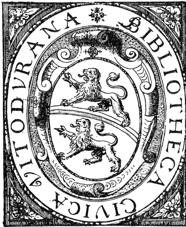
1 Exlibris der Bürger-(Stadt-)Bibliothek, 17. Jahrhundert (Graphische Sammlung).

Wie überall rief das Revolutionsjahr 1798 Zeitungen ins Leben, in der Eulachstadt zuerst das «Wochenblatt», dem weitere Presseerzeugnisse folgten. Von den Drucke-