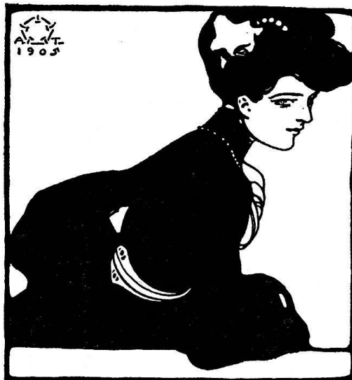
Aus dem Auktionskatalog 124 von Kornfeld & Klipstein | L'art ancien S. A.: Terzi (Novissima).