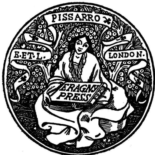
Aus dem Auktionskatalog 124 von Kornfeld & Klipstein | L'art ancien S. A.: Lucien Pissarro.