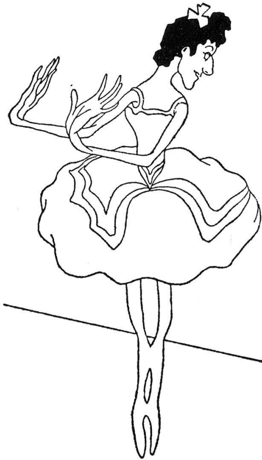
Zambelli, danseuse italienne