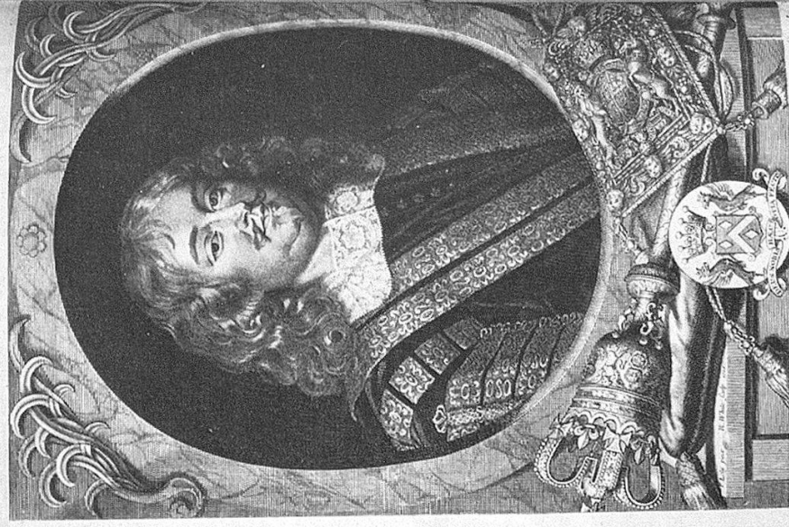
Edward Earle of CLARENDON, Lord High CHANCELLOR of England, and Chancellor of the University of Oxford, &c. &c. &c.

O X F O R D, Printed at the THEATRE, An. Dom. MDCCL.