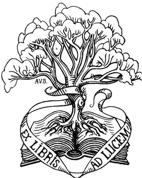
D Marque d'éditeur de Ch. Eggimann à Paris. Dessin original de Valentin Baud-Bovy.

sur les monuments et sur l'art français. C'est ainsi qu'en l'espace de dix années, il édita 33 volumes in-folio et 37 volumes de format