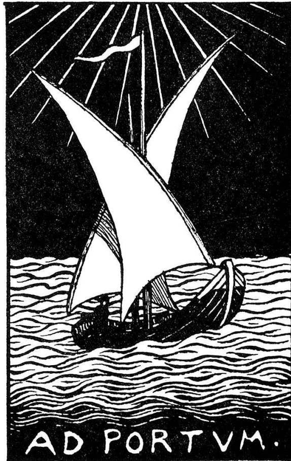
A Marque d'éditeur de Ch. Eggimann à Genève. Dessin original de Félix Vallotton.

Mais Eggimann est mû par le désir de créer, et, très tôt, il se lance dans l'édition.