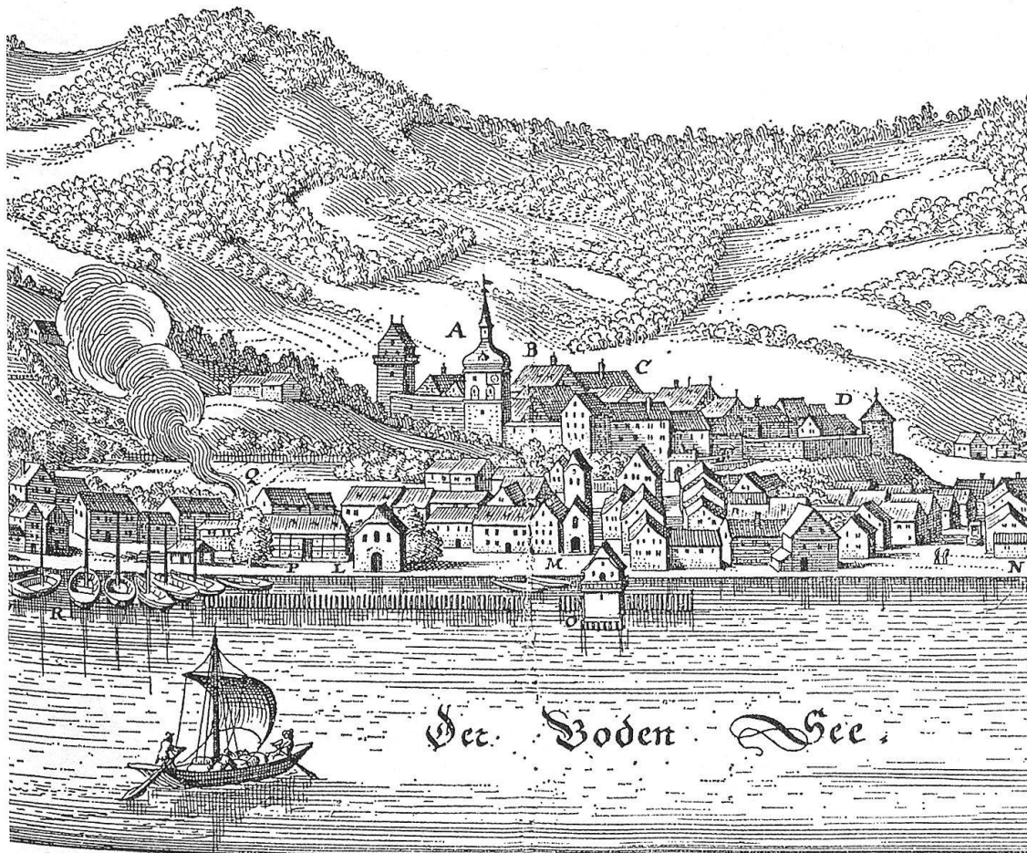
Ausschnitt aus einer Radierung von Matthäus Merian mit der Ansicht von Bregenz, 1648.