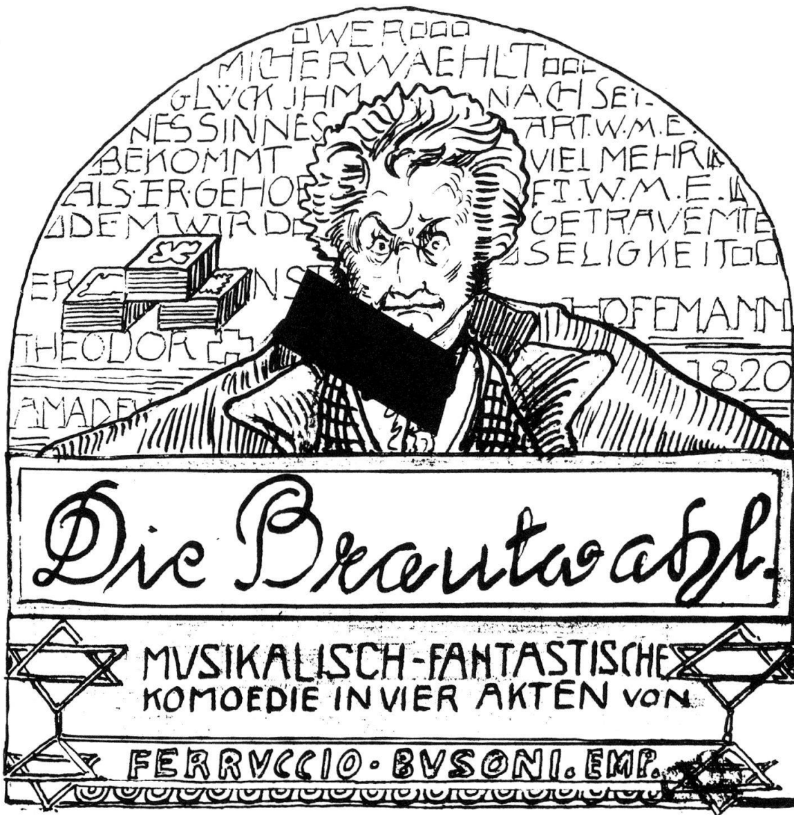
Pen drawing by Busoni for the title page of his MS of the libretto to 'Die Brautwahl' (ca. 1906).