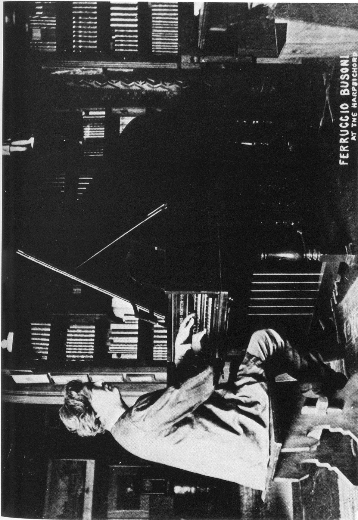
FERRUCCIO BUSONI AT THE HARPSICHORD