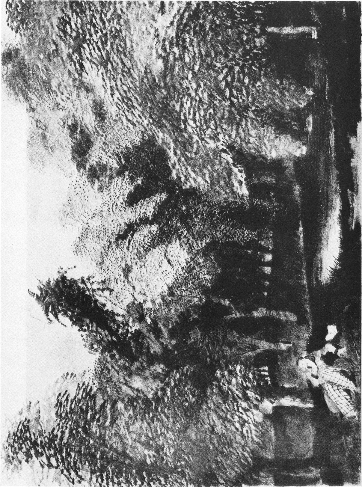
THE BARN AT WINTER A WINTER SCENE