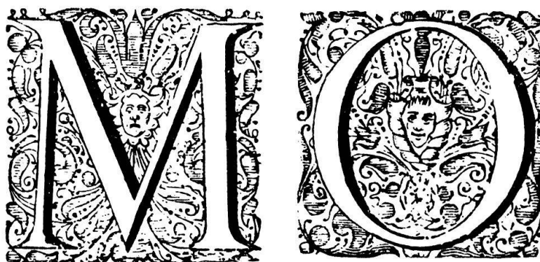
Fig. 97. Verzierte Initialen Nr. 22 der Schriftgießerei Blaeu.

Type Specimen Facsimiles . 2 Bde. Hrsg. John G. Dreyfus. Bd. 1 (1–15) mit einer Einleitung von Stanley Morison. Bowes & Bowes and Putnam, London 1963. Bd. 2 (16–18) The Bodley Head, London 1972.