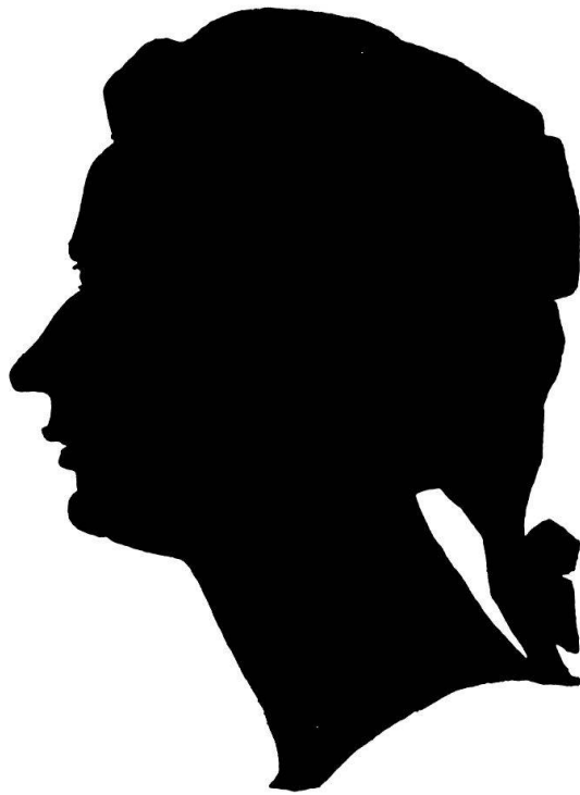
Schattenriß Johannes Müller aus Schaffhausen in jugendlichem Alter, wahrscheinlich vor seiner Abreise nach Göttingen 1769.