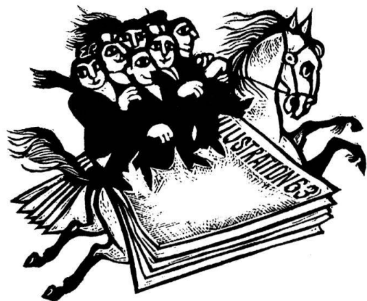
Linolschnitt von Eduard Prüssen, Köln.

Seit zehn Jahren erscheint gleichfalls bei Visel die Graphische Kunst , deren Thema ausschließlich die Druckgraphik ist und die