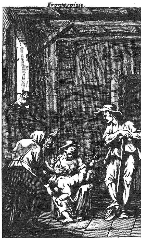
De del. Famiglia di Bertoldo. G. in

Bologna, Bibl. Com. dell'Archiginnasio, Bibl. Universitaria; Boston, Public Library; Cambridge (USA), Harvard University; Londra, British Library;