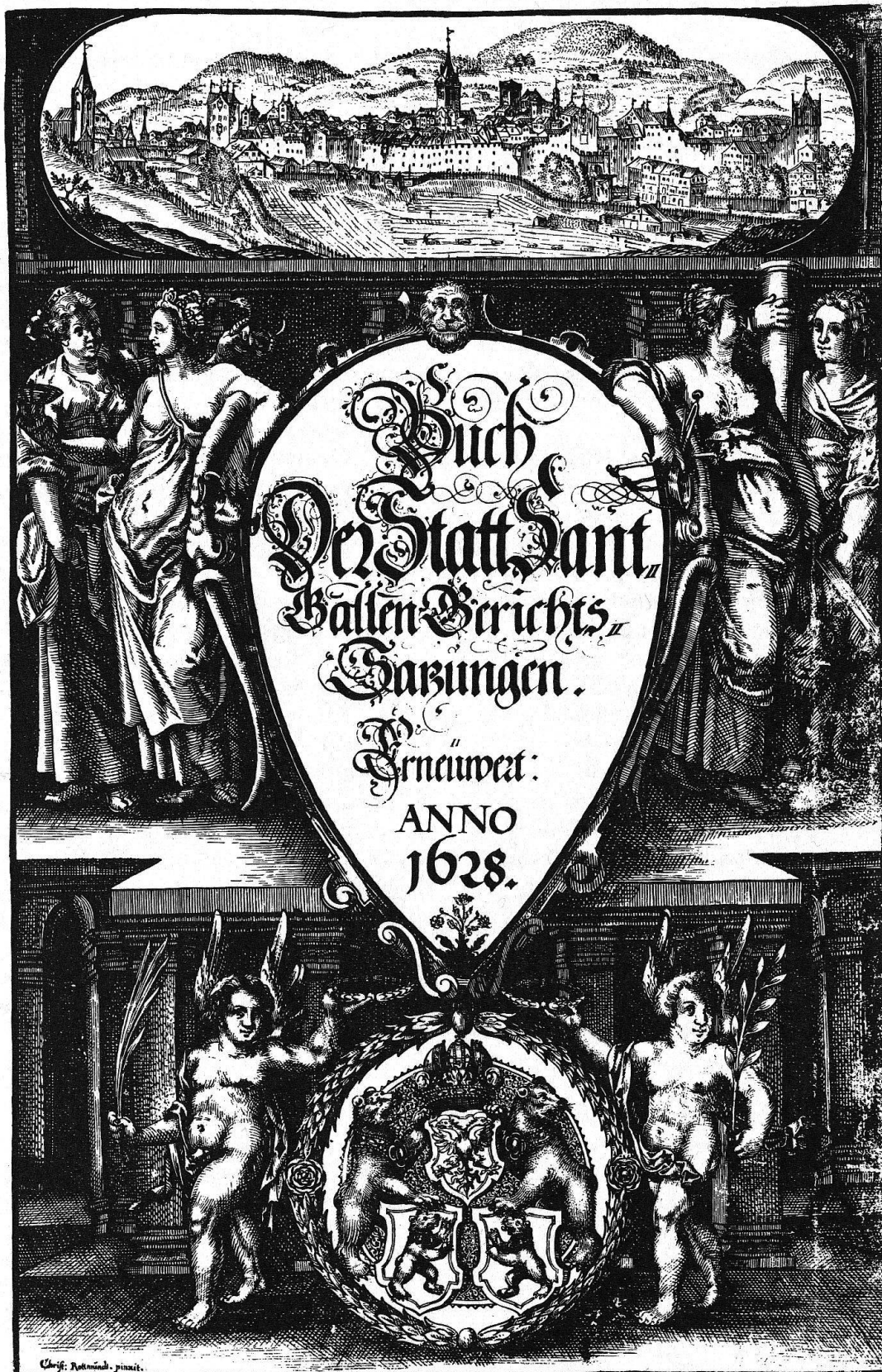
Titelseite des Gerichtsbuches von 1628 mit einer Ansicht der Stadt St. Gallen von Christoph Rothmund.