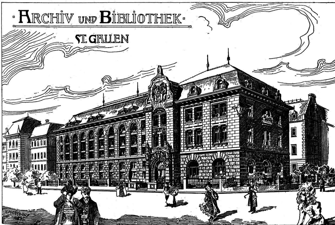
Zeichnung von Karl Mossdorf, dem Architekten des 1905–1907 errichteten Baus.

Seit wann der Stadtrat seine Verhandlungen protokollierte, wissen wir nicht. Sicher ist nur, daß das älteste erhaltene Ratsbuch oder Ratsprotokoll aus dem Jahr 1477 stammt. Seit 1477 sind die Protokolle des Rats mit wenigen Lücken um die Wende vom 15. zum 16. Jahrhundert bis auf die heutige Zeit erhalten.