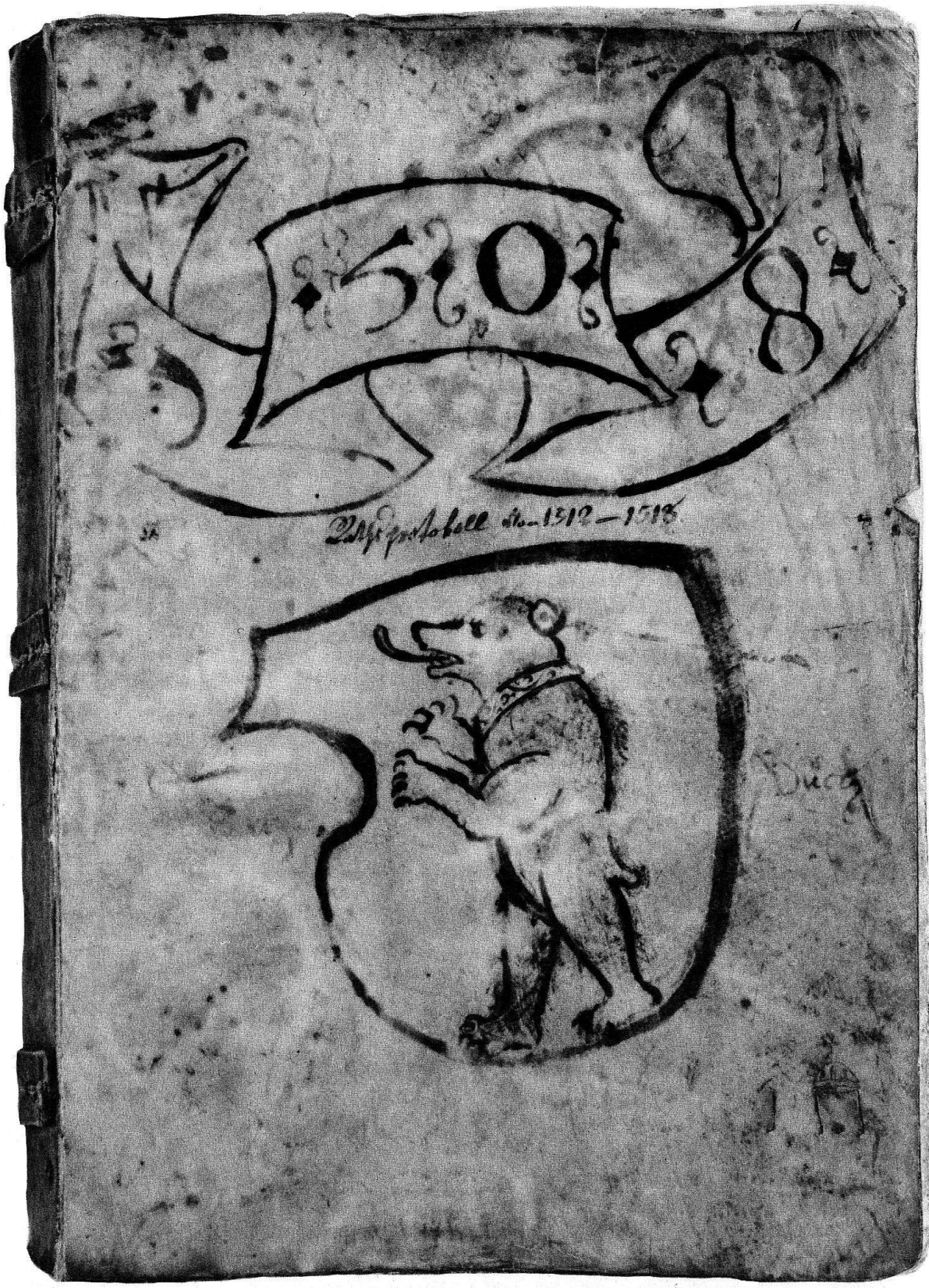
Das Ratsbuch von 1512-1518.