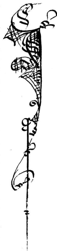
Anfangsbuchstabe im ältesten Ratsprotokoll.