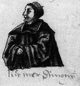
Hier mer Simonis