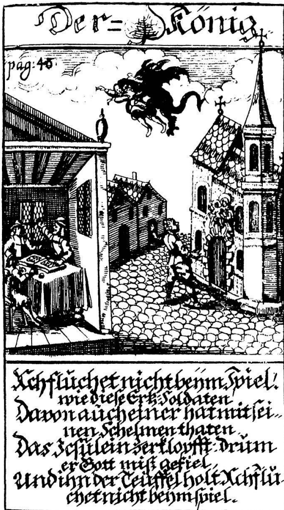
Eine nützliche Spiel-Karte für die Flucher.

werden. Das Spiel ist heute unter dem Namen Backgammon bekannt, aber als Vorläufer bereits im Grab Tutenchamuns (um 1350 v. Chr.) zu finden. Martin Luther nannte es «Wurfzabelspiel», und unter dem Namen «Tric-Trac» war es das Lieblingsspiel von Ludwig XVI. von Frankreich. Auch auf der Rückseite des Schachbrettes von Herzog August ließ sich «Tric-Trac» spielen. Merkwürdig ist, daß sich vier und nicht wie üblich zwei Spieler daran beteiligen.