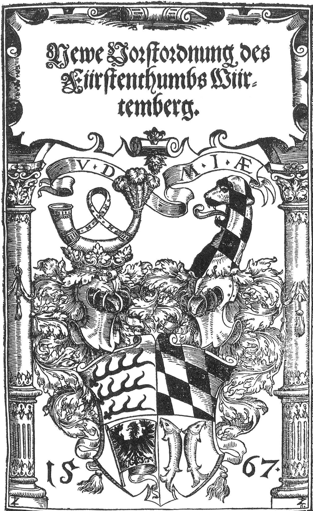
«Neue Vorordnung des Fürstenthumbs Wirttemberg.» O.O. 1567. Charakteristisch ist die Abbildung des landesherrlichen Wappens. Herzog August Bibliothek Wolfenbüttel.