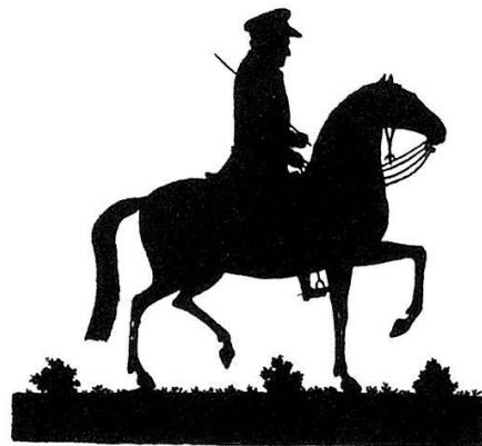
Goethe zu Pferde. Illustration auf dem Innentitel zum «Schaubücher»-Band 32.

den SB erschienen 1932 nur noch gerade zwei neue Titel, während die Kadenz in den Jahren zuvor rund ein Dutzend Titel betragen hatte. Den VR-Protokollen ist zu entnehmen, daß der Lagerbestand der SB im Frühjahr 1931 einen Wert von rund einer halben Million Franken aufwies 12 . Ein betriebliches Rationalisierungsprogramm,