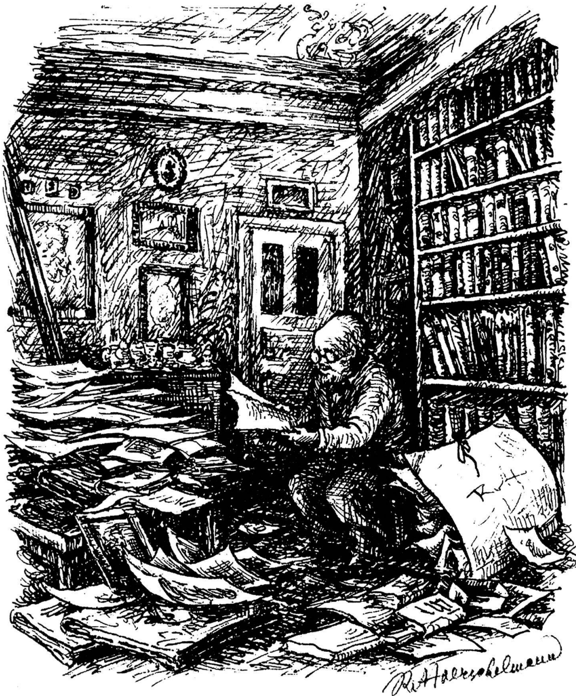
«Sammelsurium.» Federlithographie. Olivgrüner Druck auf gelblichem Papier.