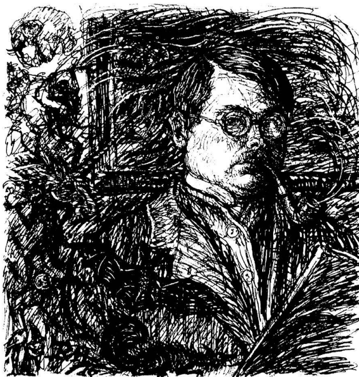
Selbstporträt 1916. Feder und Tusche mit Deckweiß. Aus dem Pfeifenrauch entwickeln sich Phantasiegestalten: Elefant, Kobold, Einhorn, Teufel, Fledermaus, Gespenst, Hexe, Drache.