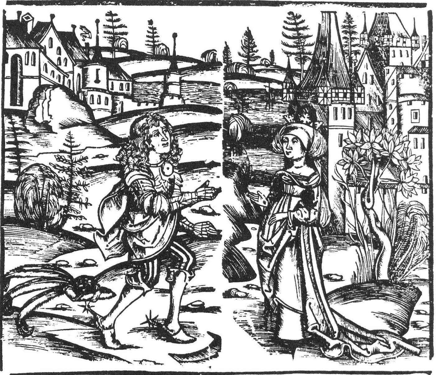
Holzschnitt aus «Ritter Pontus», Straßburg: S. Bund, 1530.

17 Katalog S. 21, Abb. zweiter Bd. von rechts /