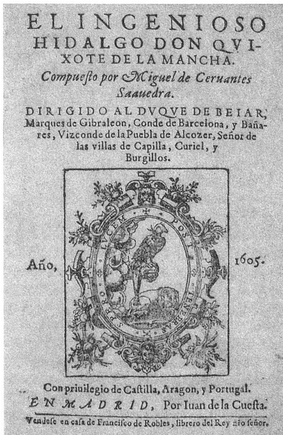
Titelblatt der ersten Auflage von Cervantes' «Don Quijote».