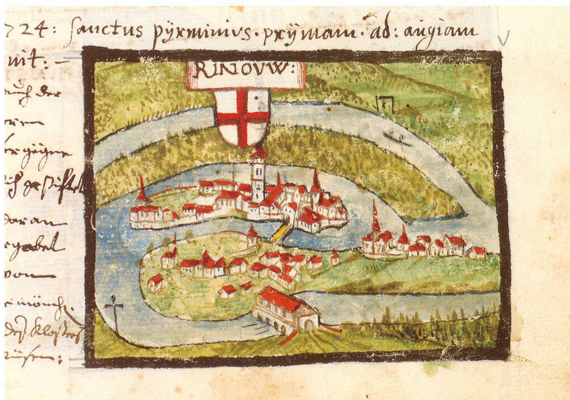
Vogelperspektive auf die Rheininsel Rheinau mit dem Kloster. 1689/90. Zentralbibliothek Zürich, Ms. 56, p. 107.

Die Kantonsbibliothek war von 1855 bis 1873 im Chor der Zürcher Augustinerkirche (1596 zur Münzstätte umgebaut) untergebracht. Sie umfaßte mehr als zwanzigtausend Bände. Mit zehn vierspännigen Wagen fuhren 1864 die Rheinauer Bücher nach Zürich. Dieser große Zuwachs an Handschriften und Drucken brachte die Kantonsbibliothek an die Grenzen ihrer räumlichen und personellen Kapazitäten. 1873 verlegte der Kanton seine