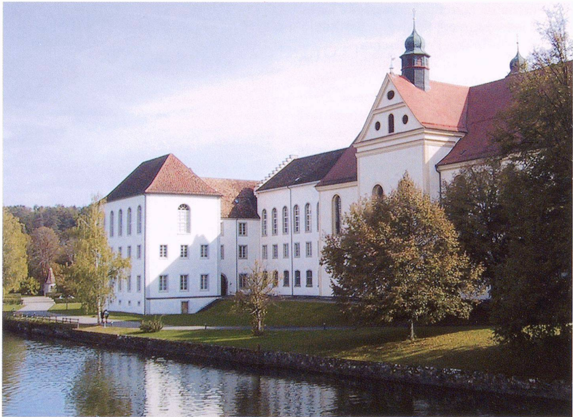
Der Bibliotheksflügel des Klosters Rheinau von 1711/17.

Die Ausstellung von 2003/2004 im Predigerchor der Zentralbibliothek Zürich stellte erstmals eine große Auswahl mittelalterlicher Handschriften aus dem ehemaligen Benediktinerkloster Rheinau vor: knapp 60 von über 200 Kodizes. Ein kleinerer Teil der Rheinauer Handschriften, mehrheitlich interne Verzeichnisse und Kataloge, gelangte nach dem Tod des letzten Rheinauer Abtes Leodegar Ineichen (1810–1876) in die Stiftsbibliothek Einsiedeln.