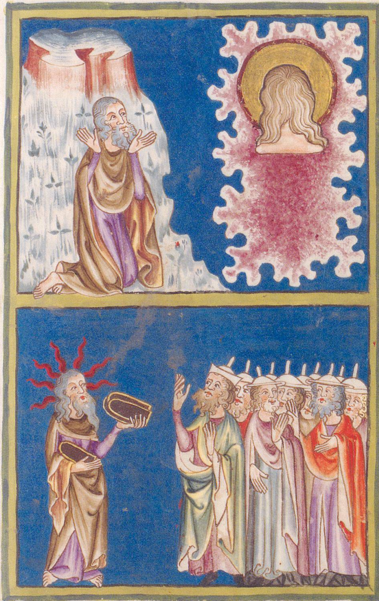
Moses vor dem brennenden Dornbusch: Gottvater von hinten gesehen. Moses übergibt die Gesetzestafeln den Juden. Weltchronik des Rudolf von Ems, um 1350. ZB, Ms. Rh. 15, f. 87r.