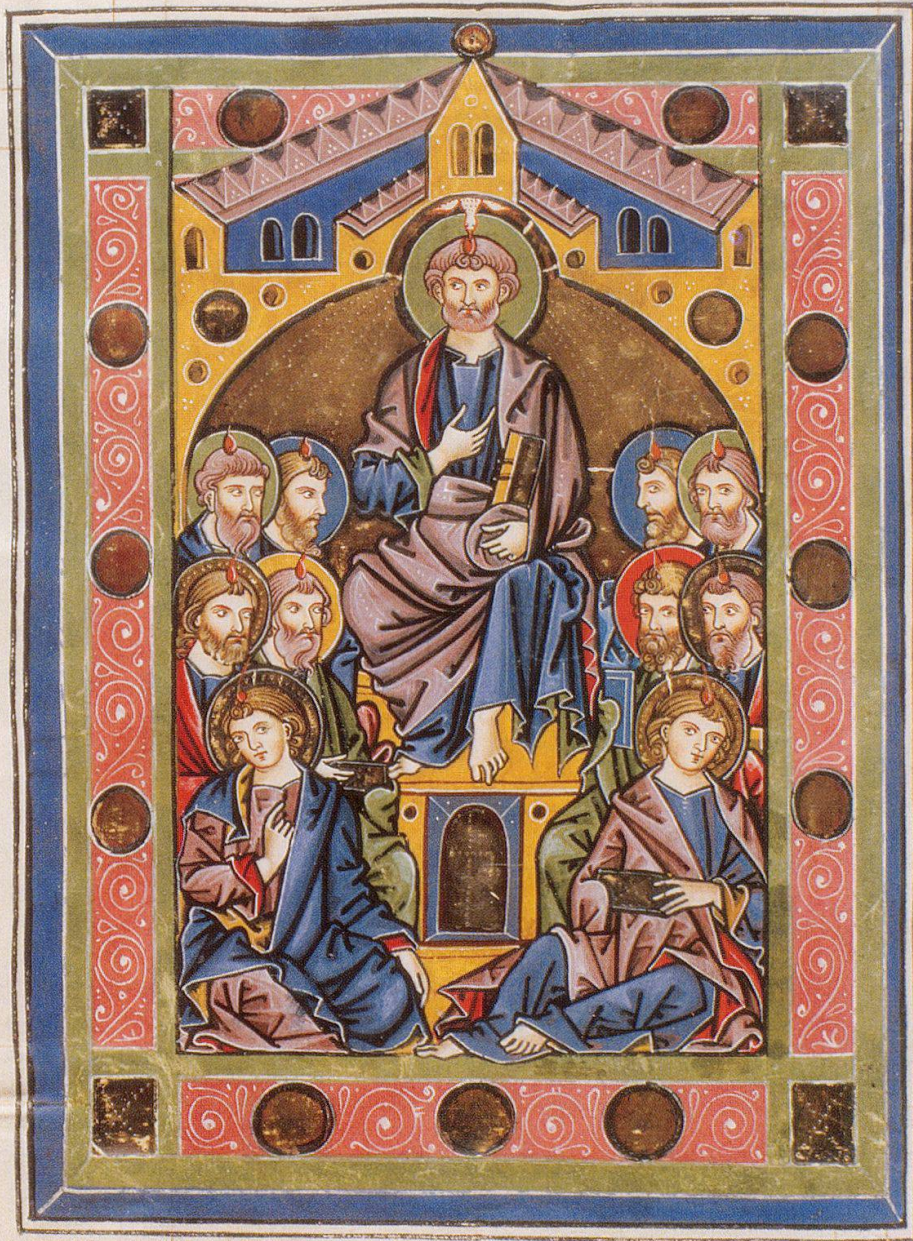
Pfingsten mit nur elf Aposteln. Das einzigartige Meisterwerk der hochgotischen Malerei um 1250 im Rheinauer Psalter. ZB, Ms. Rh. 167, f. 128v.