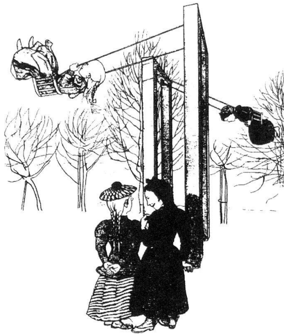
Erstentwurf Ernst Kreidolfs für «Die Schaukel» (NLB).