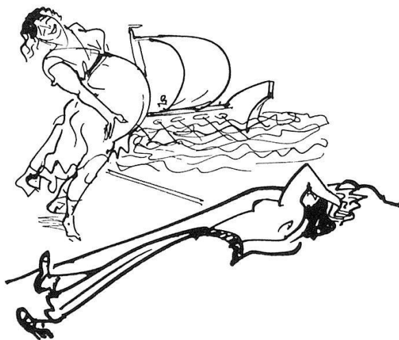
Illustration zu «Sommernachtstraum» von William Shakespeare. Federzeichnung 1954.

Das erste Geschoss des Hauses wurde im Zuge der Sanierung umgebaut, um hier regelmäßig Wechsellausstellungen aus dem umfangreichen Nachlass Hegenbarths zu zeigen. Dieser gliedert sich nach Angaben des Archivs ungefähr wie folgt: 500 farbige Zeichnungen, 80 kleine farbige Blätter, 1700 Tuschpinsel- und Federzeichnungen, 300 farbige Buchillustrationen, 5000 Buchillustrationen in Tusche gezeichnet, 2300 graphische Blätter, 3000 Graphikskizzen, 7 Skizzenbücher, 80 Radierplatten, 400 illustrierte Bücher, 150 Gemälde und 300 Arbeiten anderer Künstler, die Hegenbarth gekauft oder geschenkt erhalten hatte. Hinzu kommt die ausgedehnte Korrespondenz des Künstlerehepaars. Die umfangreichen Bestände wurden in Nebenräumen in speziell gebauten Schränken untergebracht, während die Bibliothek des Künstlers im Atelier aufgestellt wurde, wo außerdem seine Arbeitswerkzeuge publikumswirksam arrangiert sind. Aufgabe des Archivs, das nach wie vor dem Dresdner Kupferstich-Kabinett untersteht, ist neben der Erhaltung und Präsentation des Hegenbarth'schen Werkes dessen wissenschaftliche Erschließung, was schon ein Hauptanliegen Hanna Hegenbarths war und von ihr initiiert wurde. In Weiterführung ihrer Bemühungen wurden die Druckgraphiken von Axel Wendelberger katalogisiert, seit 1998 setzt Lutz Gäbler dieses Projekt mit der Aufnahme der literarischen Zyklen fort und bereitet die Publikation beider Kompendien vor. Gleichzeitig erstellt Ulrich Zesch von Stuttgart aus in Zusammenarbeit mit