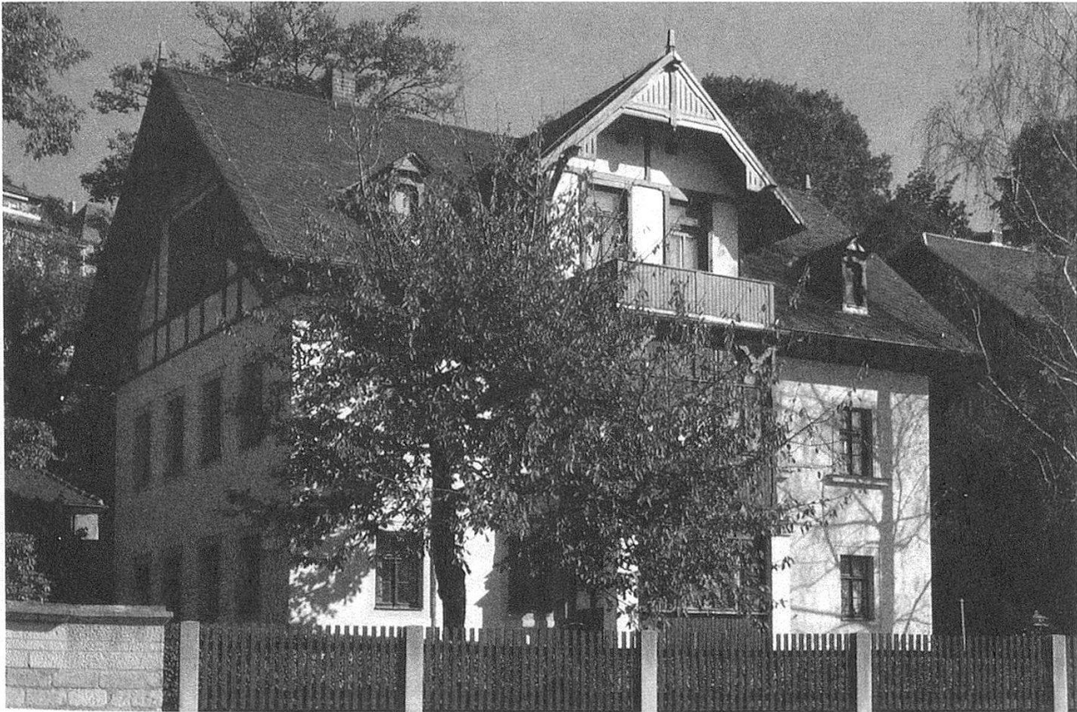
Haus von Josef Hegenbarth in Dresden.

sacht durch eine Karikatur in der «Jugend», und deshalb ausweichend viele Tierdarstellungen zeichnete, wurde er 1946 zum Professor an die Dresdner Akademie berufen und ihm die Leitung der Illustrationsklasse übertragen. Diese Tätigkeit gab er 1949, mit Erreichen der Altersgrenze, wieder auf. Sein Lebenswerk erfuhr in beiden deutschen Staaten gleichermaßen Anerkennung: 1954 erhielt er den Nationalpreis der DDR und war noch 1960 Mitglied der Bayerischen Akademie der Schönen Künste in München geworden, nachdem er bereits 1955 bzw. 1956 zum Mitglied der Akademien in Berlin-Ost und -West gewählt worden war. 1962 starb er in Dresden und wurde auf dem Friedhof in Loschwitz beigesetzt.