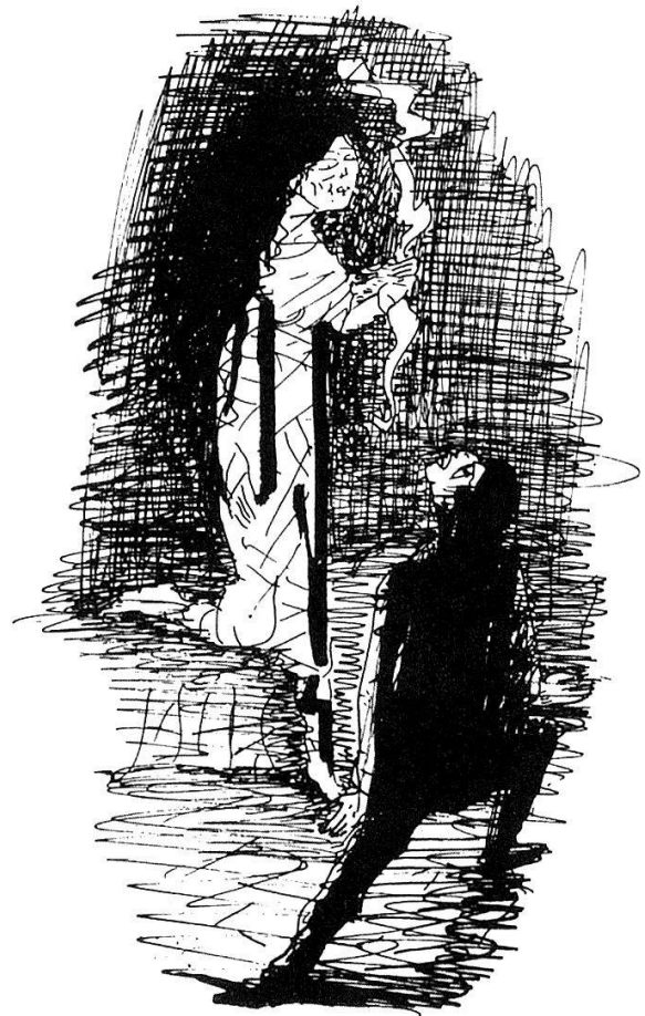
Illustration zu «Erzählungen» von Edgar Allen Poe. Federzeichnung 1961/62.

Hegenbarths gewohnt hatten, wieder mit den originalen Möbeln und Einrichtungsgegenständen ausgestattet, womit es sich heute noch in dem Zustand präsentiert, den Hanna Hegenbarth hinterlassen hat. 1957 hatte Menzhausen die Wohnung besucht und deutlich im Gedächtnis behalten: «Ich erinnere mich an eine Folge kleiner Räume mit weißen Wänden, auf denen einzelne Arbeiten des Meisters hingen – zur Kontrolle, sagte er. Frühchinesische Bronzen sah ich auf Kommoden oder Schreibpulten aus dem späten 18. Jahrhundert oder aus dem frühen Biedermeier, allesamt sächsisch, sehr einfach, auf reine Flächenwirkungen hin gebaut. Dieses ruhige Erscheinungsbild wurde belebt durch einen prachtvollen Bauernschrank mit vielfarbigen Bildfeldern in Rocailles, den er aus seiner böhmischen Heimat mitgebracht hatte, und