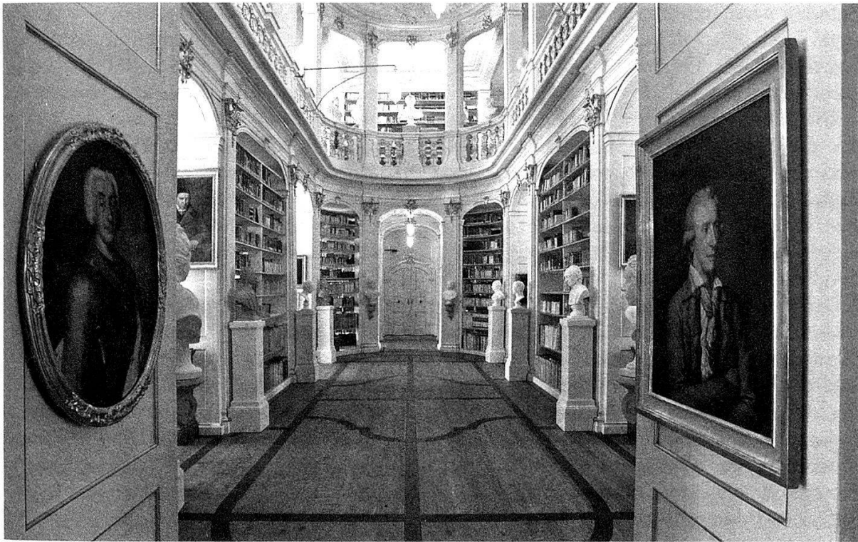
Die beiden Abbildungen zeigen den Rokokosaal der Herzogin Anna Amalia Bibliothek, der wieder zu den schönsten Bibliotheksräumen der Welt gehört. Noch sind Lücken im Bestand deutlich erkennbar.

tens einen Seitenblick auf den bibliothekarischen Alltag in unserem Land zu werfen.