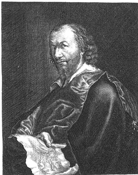
MATTHAUS MERIAN SENIOR BIBLIOPOLA ET ICONOGRAPHVS CELEBERVS Cornice defurcanti Merianus ubi sibi musaeus. Capis alius hinc volentem caecula prebent. Quis sit cum illis? Tunc loquitur: Satis. Quisquis illam Tulit: Vir Merianus erat. Utque amicum cur non, memorata, flammus. Hinc erit et meritis fama super aethera, notus. Gloria Myjarum qui fuit, atq. Decus. Fama, que meritis pondere digna solat.

Der Leinenband in Groß-Oktav ist wie die fünf vorangegangenen 2 weinrot, sein Rückentitel mit Verlagssignet goldglänzend. Davon angehaucht erscheinen auf dem apart schmucklosen, rückseitig unbedruckten Schutzumschlag im Ton des Werkdruckpapiers (gedämpftes Elfenbein) Me-