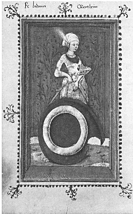
Rektoratsmatrikel, fol. 69v. Das Wappen des Rektors Ludwig Odertzheim (1486) zeigt einen Kringel, der wohl den Anfangsbuchstaben des Namens versinnbildlicht. Das Wappen wird gehalten von einer zarten Frauenfigur auf rotem Grund, die noch ganz die feine Sensibilität gotischer Kunst zeigt.

jeder Seite erwartet einen Reizvolles und Interessantes. Von den prächtigen Bildern angezogen, kann sich der Leser in die Geschichte vertiefen. Das ist heute ohne allzu große Mühe möglich, denn der Text ist ediert (Wackernagel 1951–1956), und die