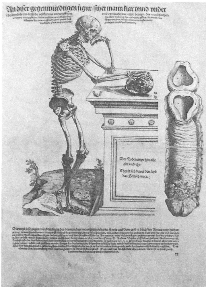
Österreichische Nationalbibliothek, alte Drucke aus dem habsburgischen Fideikommiss. Andreas Vesalius, Werbeschrift für die 1543 in Basel gedruckte «Anatomie» mit frühesten menschlichen Skelett-Abbildungen.

stein, der Stammburg der Familie Esterházy. Die im 13. Jahrhundert erbaute Burg wurde 1622 von den Esterházy übernommen und zu einem barocken Bollwerk gegen die Türken ausgebaut. Sie diente zugleich als Schatzkammer für die Türkenbeute wie auch als Ahnengalerie mit 230 lebensgroßen Porträts der Familie. 1695 wurde dieser Festungsbesitz in ein Fideikommiss umgewandelt. Die Pflege der aristokratischen ungarischen Vorfahren ging so weit, dass neben vielen Familienporträts auch etwa 30 «Phantom»-Ahnen samt Ehefrauen aus dem europäischen Hochadel konstruiert und in Gemälden festgehalten wurden, um die Würde und das Ansehen der Fami-