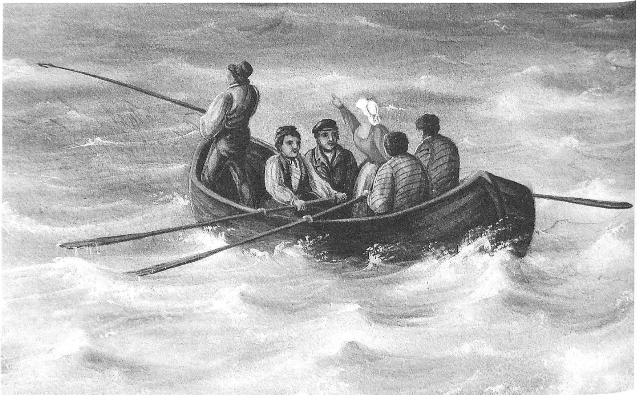
Im Ruderboot bei stürmischer See zurück in den sicheren Hafen von Rotterdam. (Detail aus Blatt Nr. 78)

anderem nach London oder Amsterdam. 1837/38 hielt er sich im Rahmen einer solchen Geschäftsreise am Zarenhof in St. Petersburg auf. Louis Bleuler starb 58-jährig am 28. März 1850 auf Schloss Laufen. Seine Frau Antoinette führte den Verlag bis zu ihrem Tod im Jahre 1873 weiter.