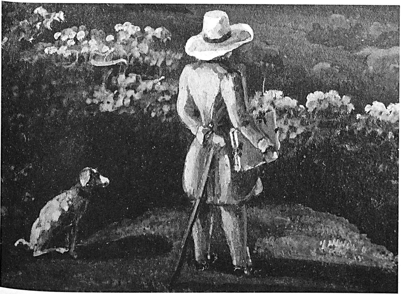
Der Maler mit seinem Hund, dem treuen Begleiter auf seiner Rheinwanderung, blickt von der Anhöhe Richtung Liechtensteiner Unterland und nach Vorarlberg. Die Zeichenmappe hält er unter den rechten Arm geklemmt, mit der Linken stützt er sich auf seinen Wanderstab. (Detail aus Blatt Nr. 27)

Bereits in Feuerthalen begann sich Vater Johann Heinrich Bleuler intensiv mit dem Rhein als Motiv für seine Arbeiten zu beschäftigen, und die Lage des Ateliers in der Nähe des vielbewunderten Rheinfalls dürfte ihn noch darin bestärkt haben, sich den malerischen Orten und Landschaften am Rhein zu widmen. «Der Strom entwickelte sich in der Folge zum wichtigsten Bildmotiv der Bleuler. Während Johann Heinrich mit Vorliebe nahe gelegene Rheinregionen dargestellt und damit durchreisende Kundschaft angesprochen hatte, widmete sich der im väterlichen Atelier ausgebildete Louis dem gesamten Rheinlauf.» 8 Die Gesamtausgabe der Rheinreise von den Quellen des Vorder- und Hinterrheins