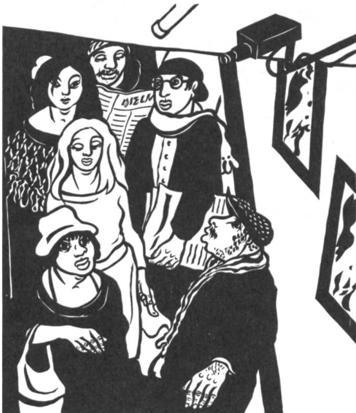
Heinz Keller: «Underground.» «Abgang in die U-Bahn (London).» [18]