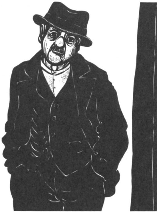
Heinz Keller: «... und er allein stumm!» [2]

Gestalt des von ihm illustrierten Werkes. In seinem eigenen Verlag konnte Keller jedoch alle Bereiche der Buchgestaltung, beginnend bei der Auswahl des Textes (oft sind es eigene Texte), Schrift und Typografie, Papier und Einband selbst bestimmen. Die handwerkliche Seite des Büchermachens reizte ihn. Die Entscheidung über die Einbandart, ob Pappband oder Halbgewebeband, traf er ebenso sicher wie er die Herstellung verschiedenartiger Buchmappen und Schuber beherrschte. Wo immer möglich setzte und druckte er den Text in Bleisatz. Seine besondere Liebe galt dem Faltpapier, dem Leporello. Hier konnte er fortschreitende Bildergeschichten mit seinen Holzschnitten am besten darstellen.