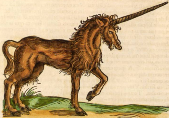
Figura hæc talis est, qualis à pictoribus ferè hodie pingitur, de qua certi nihil habeo.