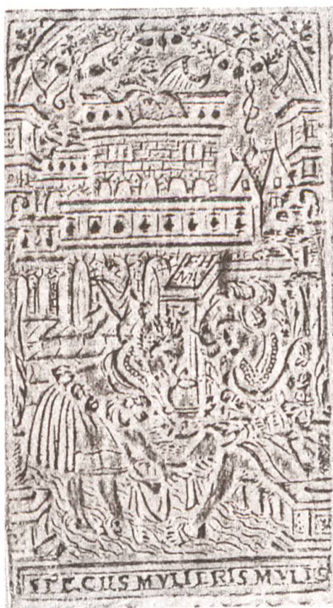
Durchreibung der Platte «David und Bathseba» (EBDB p002274) in der Einbanddatenbank ( www.hist-einband.de ). Vergleiche die gegenüberliegende Abbildung.