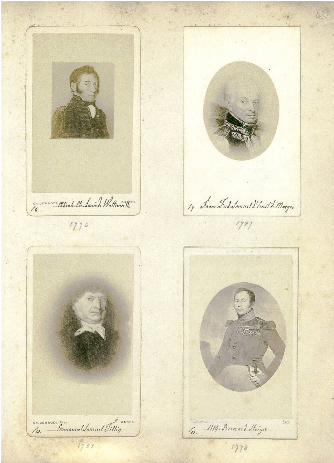
Abb. 2: Albumseite mit 4 Bildern von Generalen: Porträts von Abraham-Charles-Louis de Watteville (1776–1836), François-Frédéric-Samuel d'Ernst de Morges (1757–1833), Emmanuel-Samuel Tullier (1751–1835), Albert-Bernard Steiger (1778–1838). – Burgerbibliothek Bern, Mül var 1254:2, S. 43.