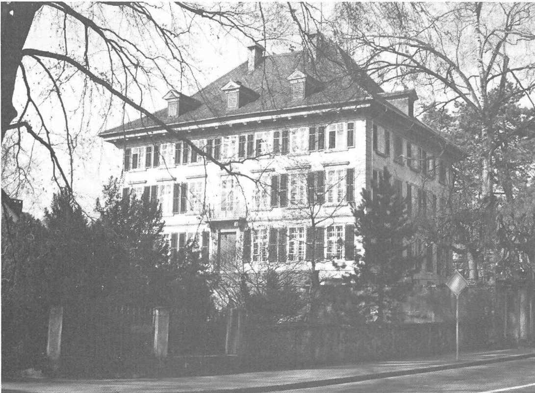
Dr. Müller-Haus am Bleicherain 7 in Lenzburg

Während die manuelle Verarbeitung von Baumwolle in Basel, Luzern und Zürich bereits im späten Mittelalter bekannt war, fand sie im ehemaligen Berner Aargau erst in der ersten Hälfte des 18. Jahrhunderts Eingang. Zu dieser Zeit ließ ein Zürcher Herrschaftsherr regelmäßig in Seengen 2 Baumwolle spinnen. Das brachte drei Bauern von Boniswil und Menziken auf die Idee, selber in Zürich Rohbaumwolle einzukaufen und sie in ihrer Nachbarschaft verarbeiten zu lassen. Von Menziken und Boniswil aus verbreitete sich die Baumwollspinnerei und -weberei gleichsam epidemieartig über den größten Teil des Berner Aargaus und die angrenzenden Gebiete. Um 1780 war die Schweiz das dichteste Baumwollland Europas; von den etwa 150 000 Arbeitern lebten 30–40 000 im Berner Aargau. Die sprunghafte Entwicklung der Baumwollindustrie in