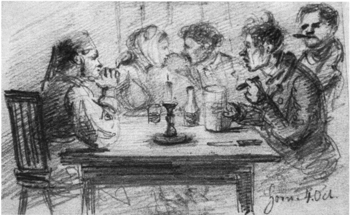
Wirtshausszene, 4. Okt. (1853?)