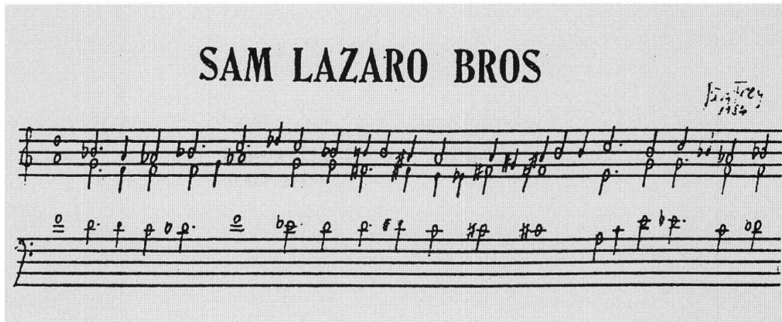
Notenbeispiel 5: «Sam Lazaro Bros»