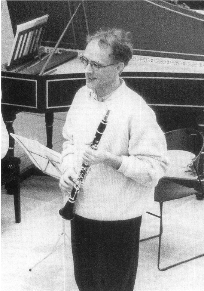
Konzert vom 12. März 1995 im Didaktikum Blumenhalde Aarau.

Das sind vielleicht Wege ins Abseits, oder besser: im Abseits, wenig beachtet. Aber sie haben einen Einklang mit dem alltäglichen Leben, mit dem Kochen, dem Kindererziehen, dem Unterrichten, dem Aufräumen, dem Schlafen. So bedeutungslos es sich beim ersten Augenschein geben mag, so wertvoll ist es doch in sich. Und wie im Alltag werden die Handlungen auch immer wieder in eine Richtung gelenkt, in die man noch gar nicht gedacht hat.