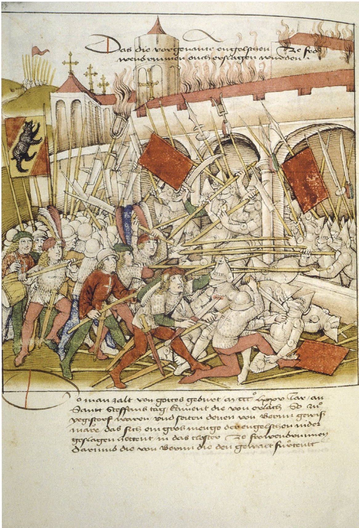
Niederlage der Gugler gegen die Berner im Kloster Fraubrunnen, 1375