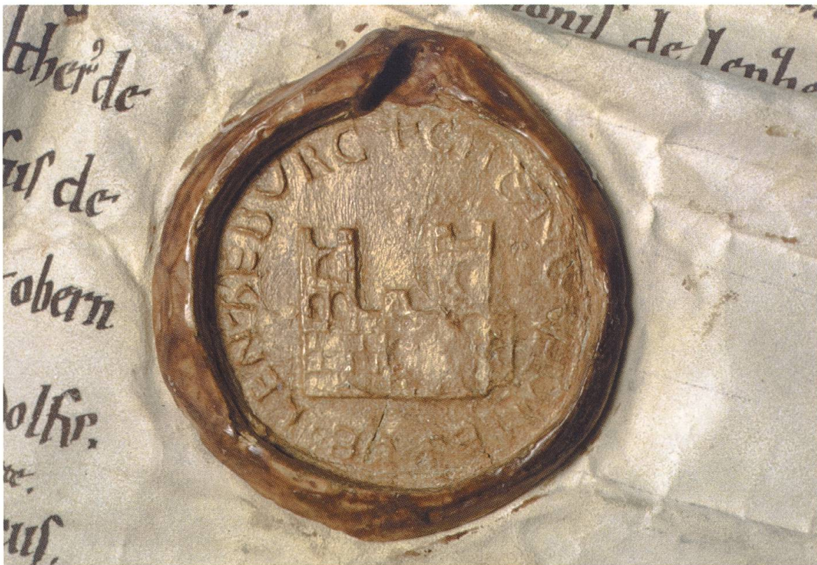
Siegel des Grafen Chuno von Lenzburg, 1167

Die letzten römischen Truppen wurden 401/406 aus dem Mittelland abgezogen. Die Zivilbevölkerung blieb indes der Gegend am heutigen Aabach treu. Die Orts-