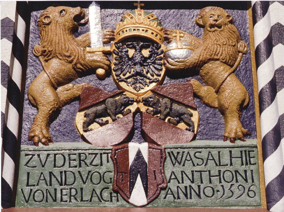
Bernerwappen über dem Haupttor von Schloss Lenzburg