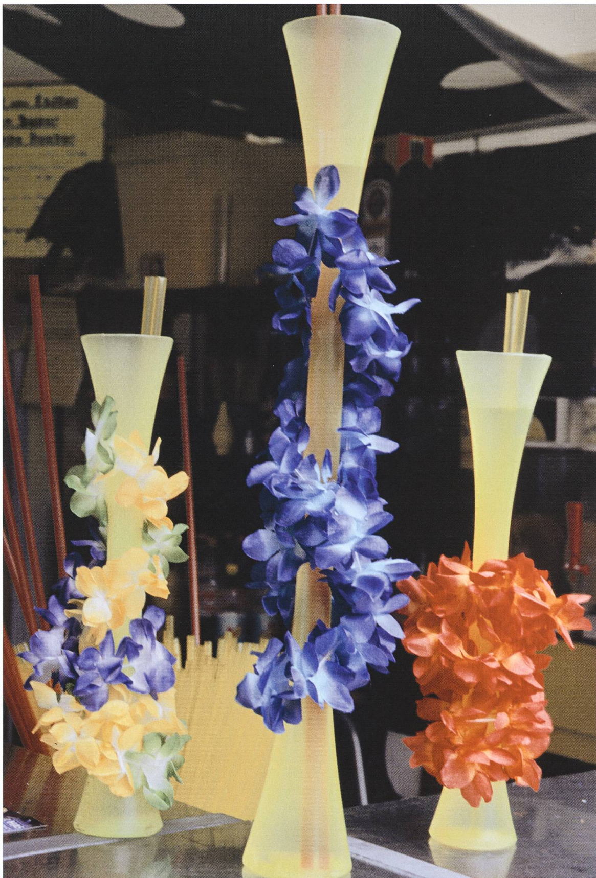
Exotische Drinks in exotischen Gläsern mit exotischen Trinkhalmen