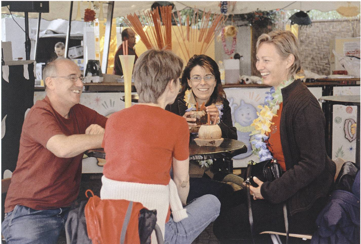
Festfreude trotz Regenschauern