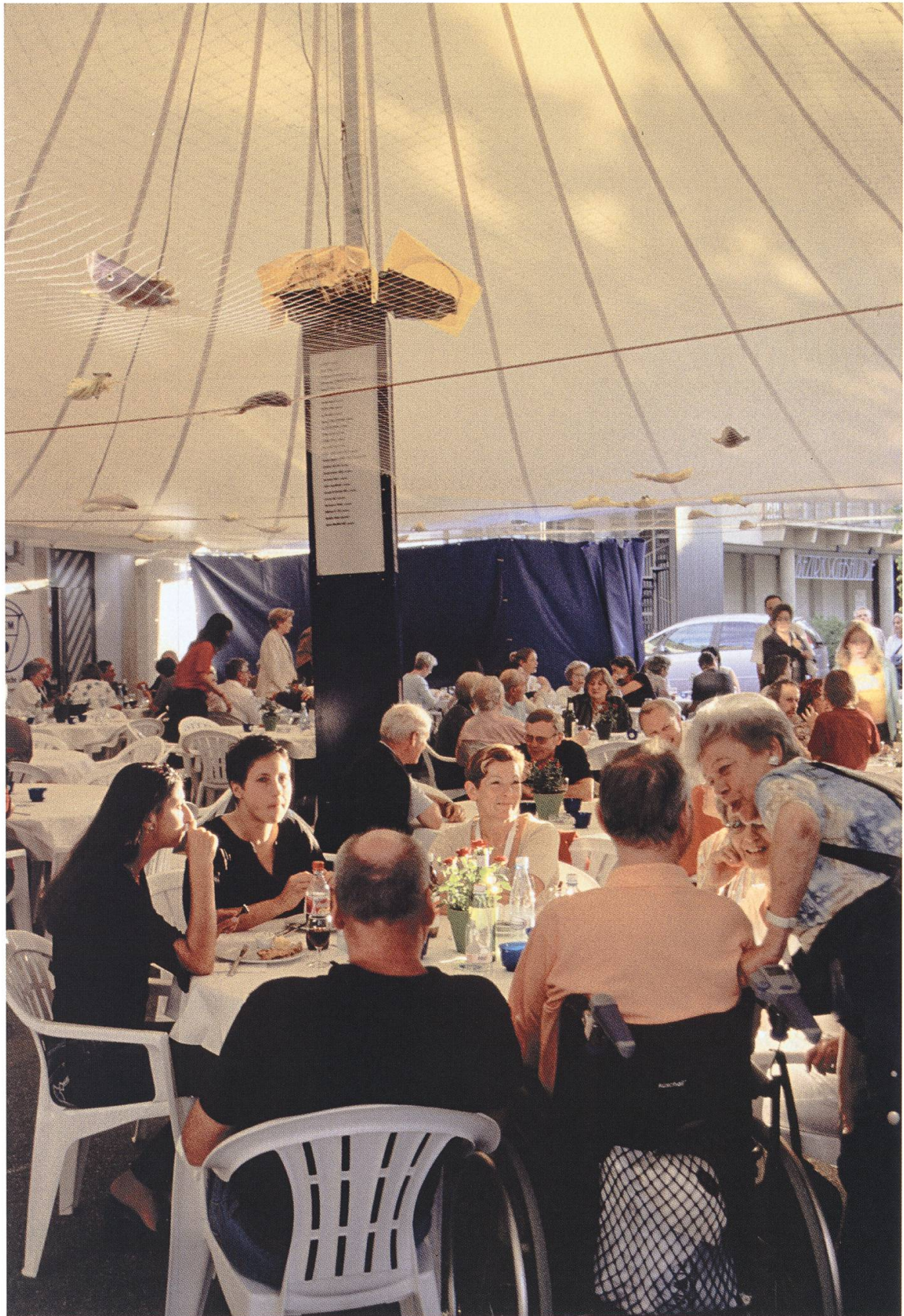
Grossandrang im Festzelt auf dem Metzplatz