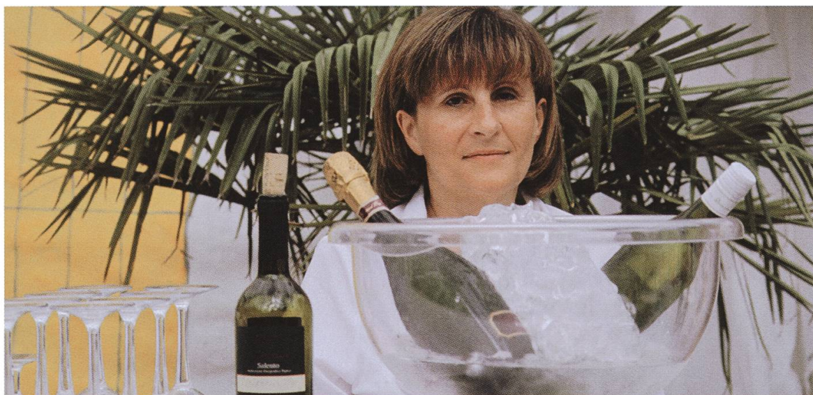
Gepflegte Bar- und Bistroatmosphäre im Lion d'Or