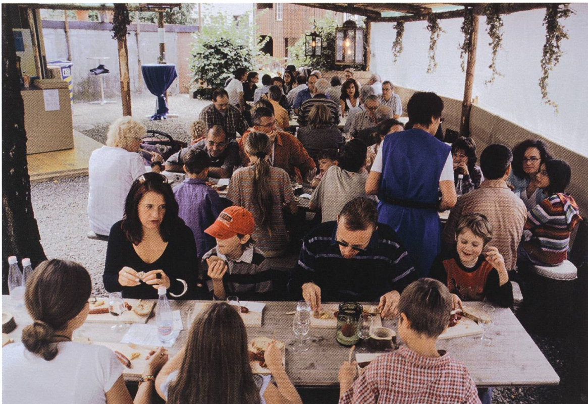
Das «Rebmannli» der ortsbürgerlichen Rebbauern-Vereinigung im Stadtgässli

Ein bleibendes Andenken an das Stadtfest konnten sich die Gäste in der von der Heilpädagogischen Sonderschule betriebenen «Schenke zum Goldenen Taler» selber schaffen: Mit dem Vorschlaghammer punzte man sich unter Anleitung der