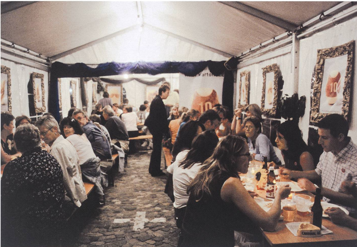
Die Händöpfelburg der Turnvereine Hendschiken war stets gut besucht

Als anpassungsfähig erwiesen sich die meisten der als «Sommerbars» konzipierten «Zapfstellen», welche sich in den Zeitzonen des 20. und 21. Jahrhunderts mit Palmen und tropischen Drinks installiert hatten: Mit heissem Punsch und Heizstrahlern sorgten sie für Sonnenwärme. Die CH Disco Remember Bar offerierte Drinks in Halbliter- und Liter-Jumbogläsern mit so langen Strohhalmen, dass man selbst am Ballermann gute Figur machen würde. Der Verein schöner Festen lockte