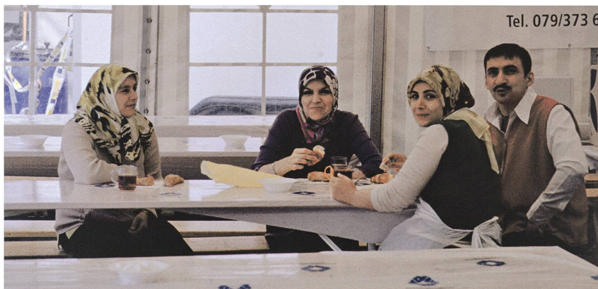
Frühstückspause im Sultans Palast